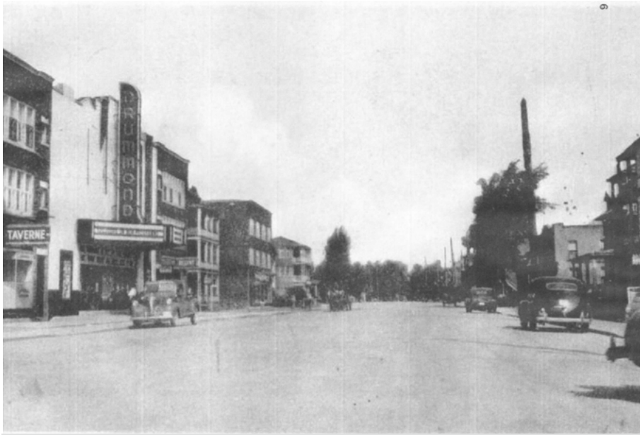
Vue de la rue Lindsay, Drummondville, Québec-23. Carte postale 1930-1940.