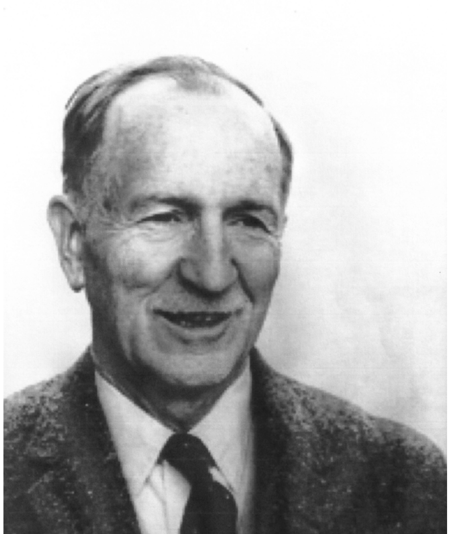
Everett Cherrington Hughes (1897-1983). ( http://classiques.uqac.ca/classiques/hughes_everett_cherrington/hughes_ec_photo/hughes_ec_photo.html ).

l'histoire et la mémoire collectives. J'en retiens quatre. D'abord, la question du retard économique du Québec. La ville décrite par Hughes est à cent lieues du village de Saint-Denis étudié par Miner. Cantonville est le théâtre d'une industrialisation qui en a transformé profondément le caractère et la forme depuis le début du XX e siècle. De grandes installations textiles ont remplacé les ateliers plus modestes qui datent de la fin du siècle précédent, attirant dans la ville un grand nombre de ruraux des régions environnantes. Ensuite, Hughes démontre bien que, même si l'idée et la réalité des deux soli-