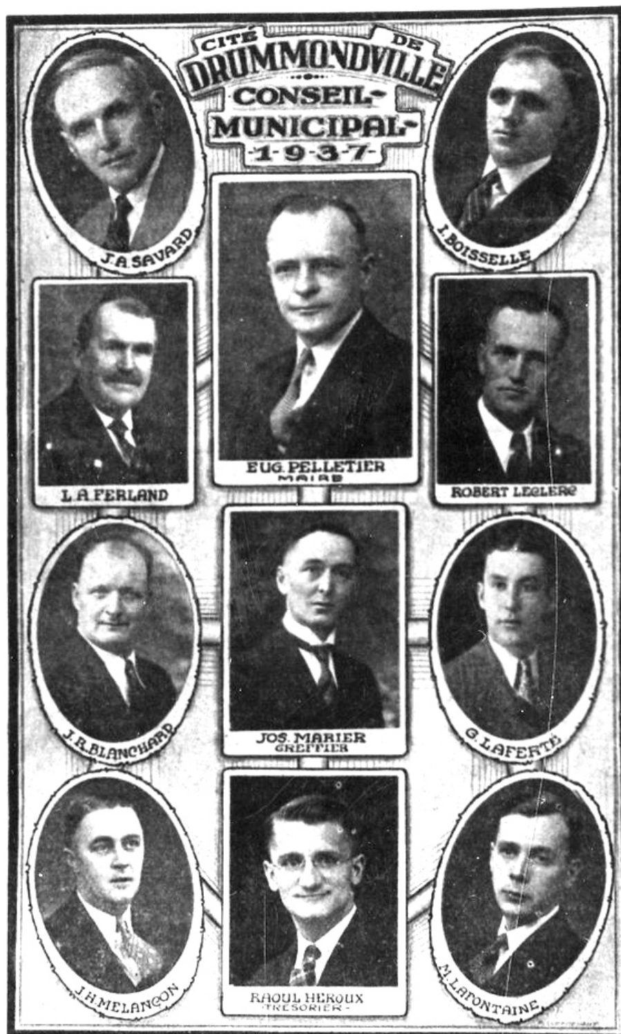
Les membres du conseil municipal de Drummondville, en 1937.

Pour un Américain enseignant à l'Université McGill, entrer dans le Québec anglophone des années 1930 n'est pas nécessairement un défi difficile à relever. Toutefois, contrairement à plusieurs de ses collègues, Hughes développera non seulement un grand intérêt pour la communauté franco-québécoise, mais il ira à sa rencontre, apprenant le français et nouant des liens étroits avec les pionniers de la sociologie québécoise, qu'il assiste d'ailleurs dans la mise sur pied de la discipline dans la province. Même après son retour à Chicago, il continuera à entretenir des liens avec des collègues de l'Université Laval et de l'Université de Montréal.