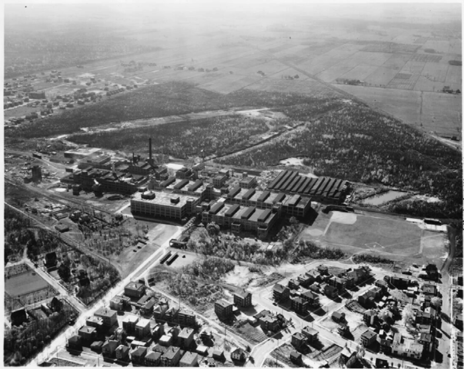
Vue aérienne de Drummondville en 1935 avec, au premier plan, la Canadian Celanese Limited Co.