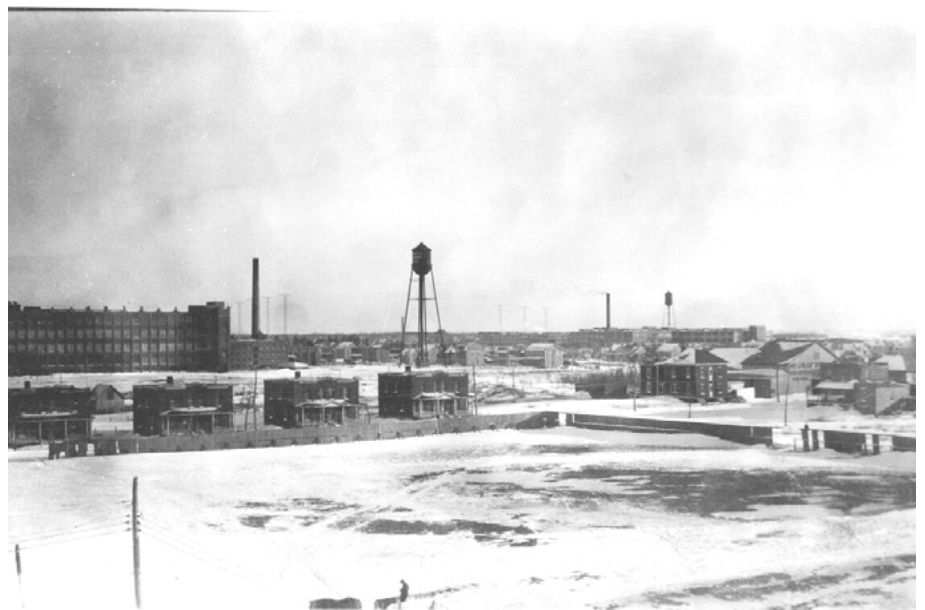
Vue de la rue Saint-Jean et de ses logements ouvriers vers 1930.

C'est dans ce contexte que se situe la contribution d'Everett Hughes. Tout au long de sa carrière, il reste loin des cadres théoriques lourds et contraignants, ce qui explique probablement le fait que ses écrits aient remarquablement bien vieilli. Sa principale contribution à la sociologie est de nature méthodologique : ses enquêtes sur le terrain se caractérisent par leur profondeur et ses observations, par leur grande perspicacité. C'est en réaction aux travaux d'un de ses collègues que Hughes tournera son attention vers Drum-