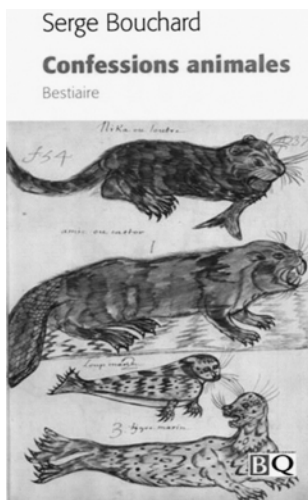
Serge Bouchard. Confessions animales. Bestiaire . Montréal, Bibliothèque québécoise, 2013, 206 p.

D'entrée jeu, signalons l'excellente initiative de cette réédition regroupant les textes intégraux des deux bestiaires pu-