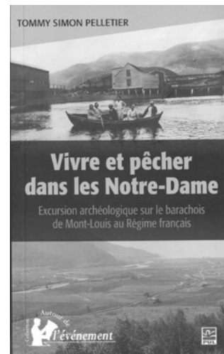
Tommy Simon Pelletier. Vivre et pêcher dans les Notre-Dame. Excursion archéologique sur le barachois de Mont-Louis au Régime français . Québec, Les Presses de l'Université Laval, 2014, 192 p.

« Une occupation euro-canadienne a pris place sur le barachois de Mont-Louis au cours du Régime français. » C'est l'hypothèse qui nous guide à travers les fouilles archéologiques, les documents d'archives et les récits oraux présentés dans ce livre. Ainsi, l'on y découvre les habitants du village de Mont-Louis, établissement permanent vivant de la pêche à la morue et l'un des premiers de la Gaspésie.