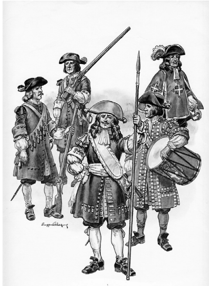
Carignan-Salières Regiment – Governor's-General Guards, Canada, Eugène Lelievre, 1980. Planche n° 493, série Military Uniforms in America (MUIA) © The Company of Military Uniforms. Photo : René Chartrand. (Musée du Château Ramezay).

que la Nouvelle-Angleterre se peuple à un rythme accéléré, le nombre de colons établis par la France en Nouvelle-France stagne. À l'aide de cartes, nous prenons connaissance de la répartition des colons sur les bords du Saint-Laurent, et de celle des divers groupes autochtones sur le territoire. Le grand enjeu mis en