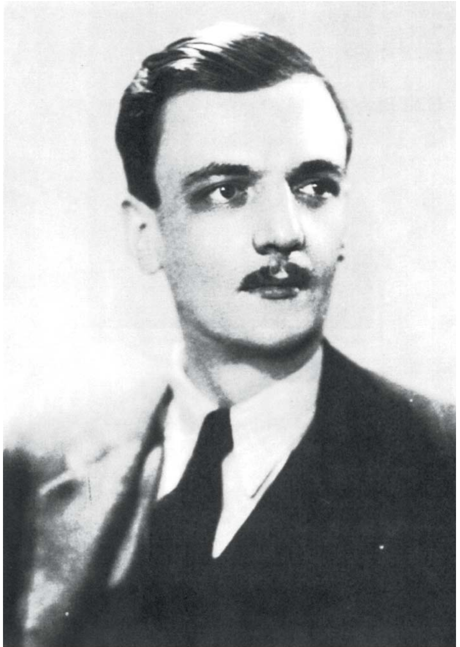
André Laurendeau (1912-1968), journaliste et homme politique, directeur de l' Action nationale (1922-1954), directeur et rédacteur en chef du Devoir.

Après 1763, la métropole britannique cherche un appui aristocratique et religieux dans sa nouvelle colonie d'Amérique du Nord. Elle compte sur les seigneurs de la colonie comme sur un pouvoir aristocratique, tout comme dans son système nouveau à l'époque de monarchie constitutionnelle, elle fait perdurer le pouvoir royal, le pouvoir aristocratique de la chambre des Lords à côté du pouvoir démocratique de la Chambre des communes. La métropole, qui s'appuie sur l'Église anglicane, est capable de voir dans l'Église catholique de la colonie une alliée possible, qui partage ses valeurs monarchiques, mais dont elle doit s'assurer de la loyauté en rendant son existence conditionnelle à son loyalisme.