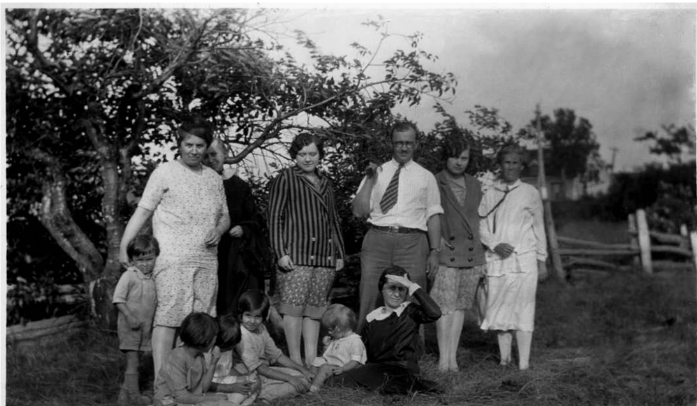
Trois générations. Photographie des années 1930.