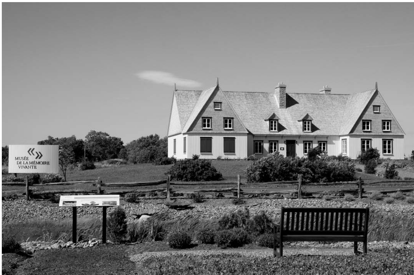
Le Musée de la mémoire vivante à Saint-Jean-Port-Joli.

Notre mode de vie moderne favorise peu la transmission orale entre générations. L'éclatement des noyaux familiaux en est l'une des causes. Il a entraîné,