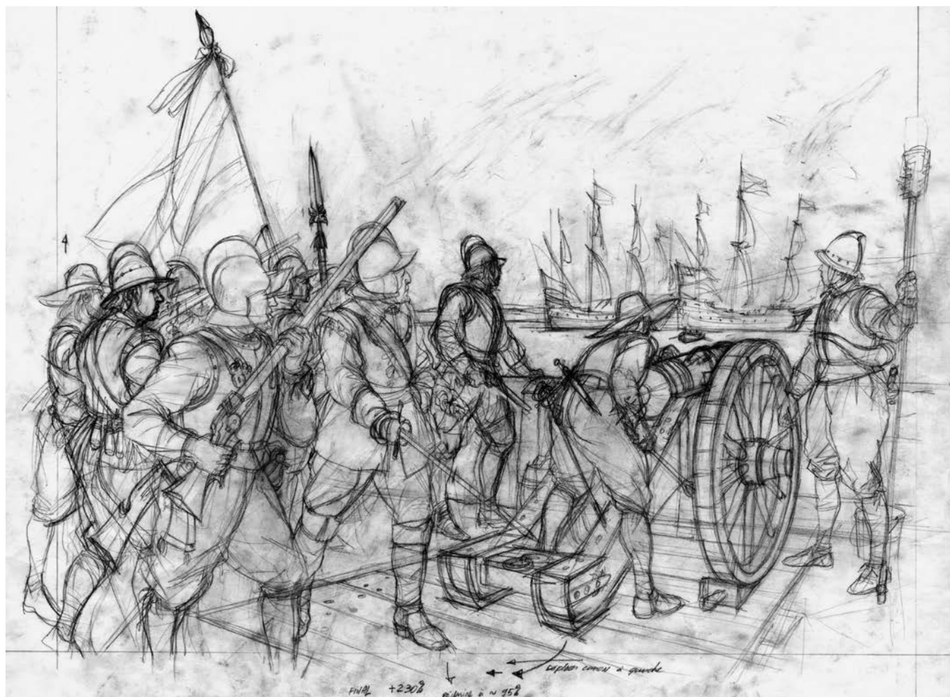
Attaque des frères Kirke à Québec, en 1629. (Illustration : ©Francis Back).

désir de créer de belles images, mais pour autant qu'elles soient le plus exactes possible. Au contact de ces gens, je me suis totalement reconnu dans cet objectif de mettre l'art au service du savoir historique.