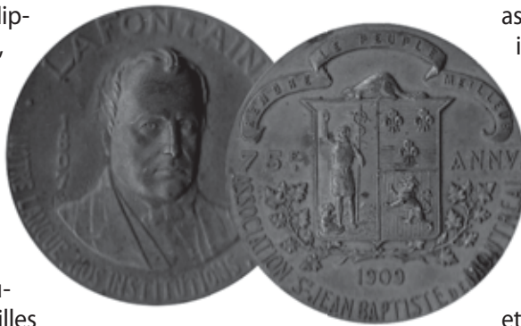
Avers et revers de la médaille Louis-Hippolyte La Fontaine de 1909.