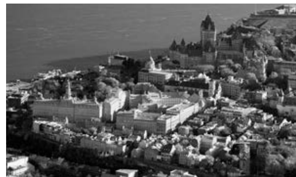
Vue aérienne de l'ensemble des bâtiments du Séminaire de Québec.

accepte de contribuer à l'éducation des jeunes gens, prenant le relais du collège des Jésuites. Le règlement de M gr Jean-Olivier Briand indique bien ce passage. Ce collège, taillé sur le modèle des collèges des Jésuites (Philippe Rocher, 2011), essaïmera et, bientôt, lorsque le Séminaire aura accepté de fonder l'Université Laval, il affiliera tous ces collèges en une faculté des arts qui construira de ce fait un réseau d'établissements d'éducation qui cultivera le goût de l'excellence. Au XX e siècle, ce réseau de collèges dispersés à travers tout le Québec servira dans plusieurs cas de base à l'édification du réseau public des cégeps.