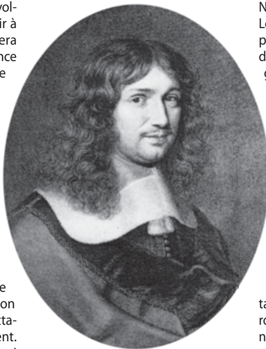
Jean-Baptiste Colbert (1619-1683), gravure Robert Nanteuil, d'après un tableau de Philippe de Champaigne, 1662.

pour le privilège du loisir. Bien différent de l'oisiveté, le loisir permet aux nobles de pratiquer des activités considérées comme valorisantes : la guerre, la chasse (passe-temps préféré du roi qui s'y adonne trois fois par semaine), le jeu, la danse, la culture de l'esprit, la mise en valeur des domaines. La cour qui gravite autour du roi est remplie de nobles qui partagent un mode de vie destiné à mettre en valeur les vertus aristocratiques, une des plus importantes d'entre elles étant de bien