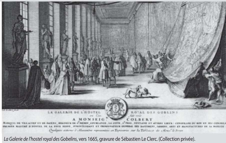
La Galerie de l'hostel royal des Gobelins, vers 1665, gravure de Sébastien Le Clerc. (Collection privée).

pour le privilège du loisir. Bien différent de l'oisiveté, le loisir permet aux nobles de pratiquer des activités considérées comme valorisantes : la guerre, la chasse (passe-temps préféré du roi qui s'y adonne trois fois par semaine), le jeu, la danse, la culture de l'esprit, la mise en valeur des domaines. La cour qui gravite autour du roi est remplie de nobles qui partagent un mode de vie destiné à mettre en valeur les vertus aristocratiques, une des plus importantes d'entre elles étant de bien