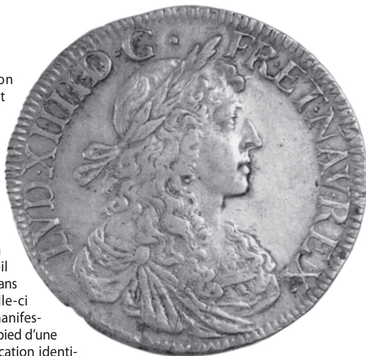
Louis XIV (1643-1715), écu (argent) au buste juvénile, frappé à Bayonne, en 1663. (Collection privée).

Le prestige royal est un instrument brillamment mis à profit par Jean-Baptiste Colbert tout d'abord et par François Michel Le Tellier, marquis de Louvois, par la suite. Colbert occupe de nombreuses fonctions qui lui permettent de fabriquer littéralement la réputation du roi entre 1661 et 1683 : il supervise les bâtiments royaux, l'Académie de peinture et de sculpture, l'Académie de France à Rome, l'Académie d'architecture, l'Imprimerie royale. De plus, Louis XIV renforce la censure tout en œuvrant à la mise en place d'un mécénat d'État qui profitera à bien des créateurs comme Molière, Jean Racine ou Jean-Baptiste Lully. Tous ces talents sont mobilisés pour projeter l'image d'un roi glorieux, victorieux