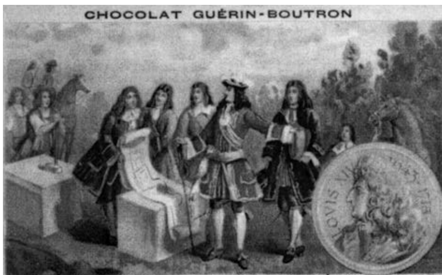
44. LOUIS XIV (1643-1715). Versailles construit par Louis XIV.

Document promotionnel du chocolat Guérin-Boutron, vers 1900. « N° 44 Louis XIV (1643-1715). Versailles construit par Louis XIV ». (Collection privée).