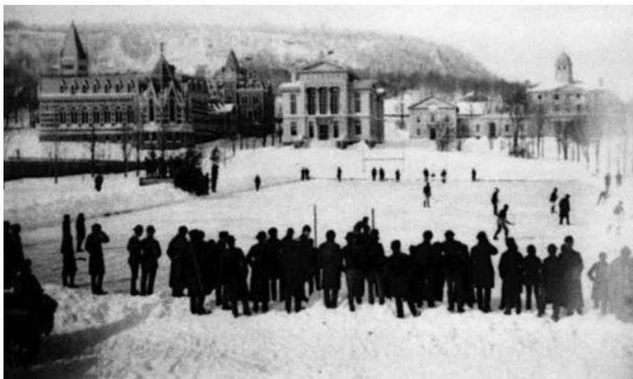
Partie de hockey, durant le Carnaval de Montréal de 1884, sur les terrains de l'Université McGill.

l'Université McGill et une équipe de Québec. Comme l'équipe de la Vieille Capitale n'avait que sept joueurs, les deux autres formations durent retirer deux joueurs de la patinoire aménagée sur le fleuve Saint-Laurent à la hauteur du port de Montréal. McGill sera la première équipe championne du hockey moderne.