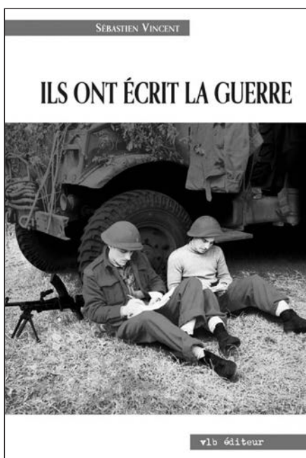
Sébastien Vincent. Ils ont écrit la guerre. La Seconde Guerre mondiale à travers des écrits de combattants canadiens-français. Montréal, VLB éditeur, 2010, 320 p.

Autant en Asie qu'en Europe, les prisonniers canadiens-français ont dû évoluer