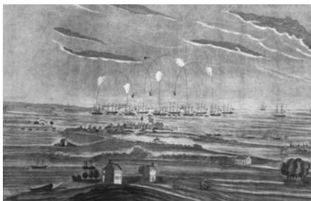
A View of the Bombardment of Fort McHenry, 1814. Gravure de J. Bower, 1816.

Aux États-Unis, cette guerre a des conséquences plus importantes sur l'identité américaine. Le blocus continental pratiqué par les Anglais en Europe stimule les initiatives manufacturières américaines et provoque, notamment, la nais-