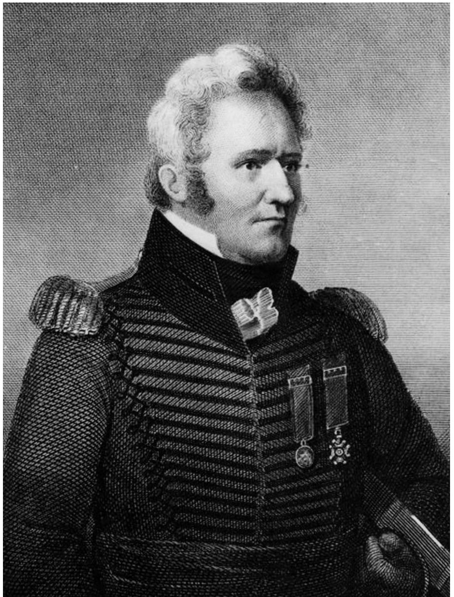
Charles-Michel d'Irumberry de Salaberry (1778-1829). Il a mis sur pied le corps provincial d'infanterie légère (les Voltigeurs canadiens), en 1812, et il a acquis une renommée durable au Canada lorsque 300 à 400 de ses hommes ont vaincu une force de plus de 5 000 Américains à Châteauguay, le 26 novembre 1813.