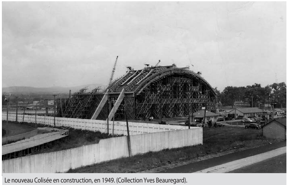
Le nouveau Colisée en construction, en 1949.

crit au registre des propriétés historiques de la Colombie-Britannique. Le Halifax Forum en briques rouges, édifié en 1926, et l'aréna W.C. O'Neill, bâtiment d'architecture moderne, construit en 1962, sont protégés en Nouvelle-Écosse et au Nouveau-Brunswick. Enfin, le Forum de Montréal (1926) et le Maple Leaf Garden de Toronto (1931) sont devenus des lieux historiques nationaux en 1997 et 2007,