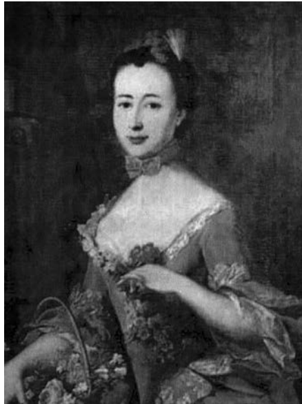
Friederike Charlotte Louise von Massow, baronne von Riedesel.

la première à décorer son sapin de Noël avec des chandelles qu'elle alluma pour symboliser le retour de la lumière avec le solstice d'hiver. C'était un tel arbre qui étonna les invités de la baronne Riedesel en 1781.