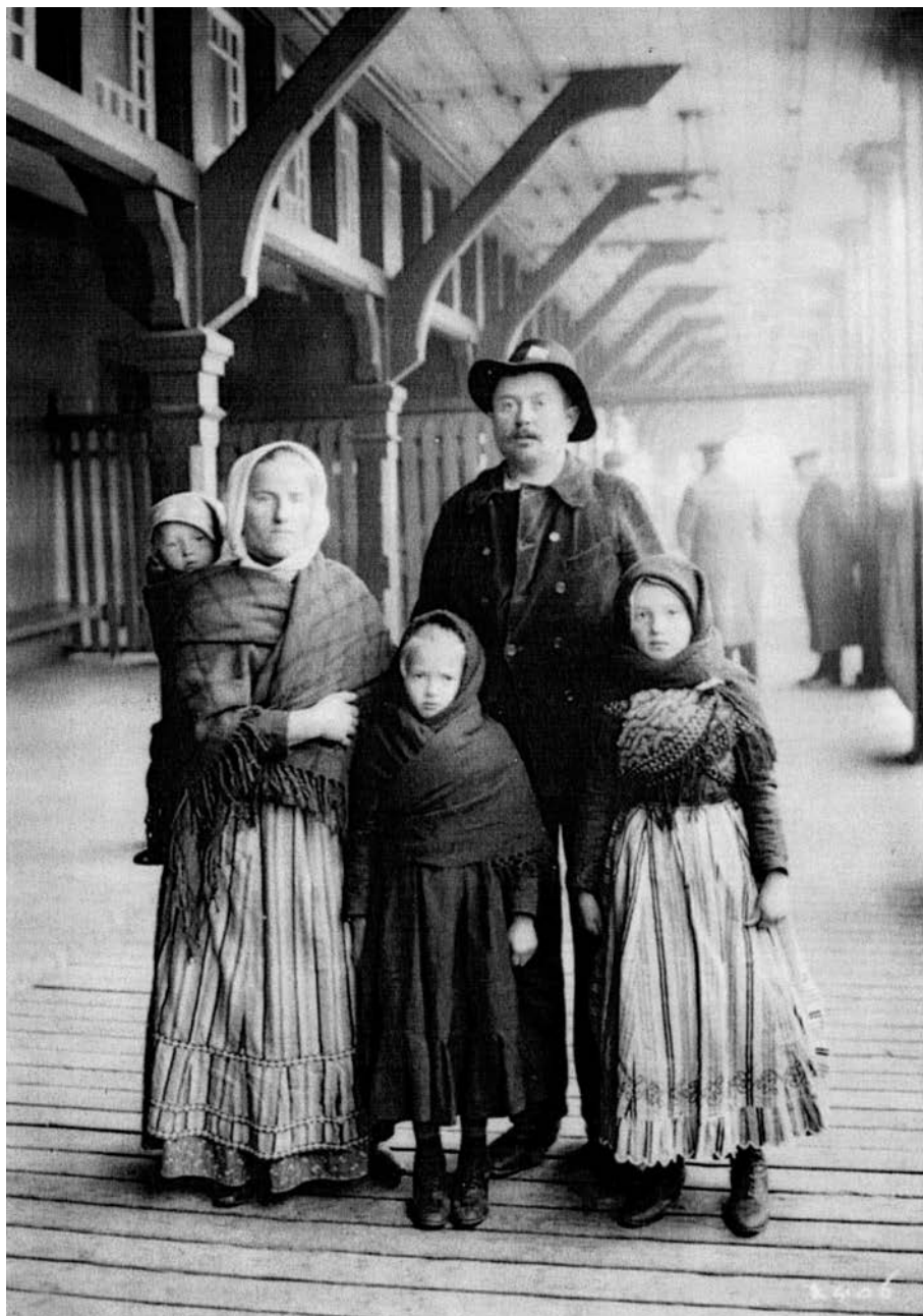
Immigrants allemands arrivant à Québec, en 1911.

codes culturels francophones apparaît calqué sur les réflexes historiques des Anglo-Québécois. Si certains répondants se sentent solidaires d'une affirmation nationale québécoise susceptible de réagir à l'oppression passée, peu souscrivent à l'idée d'indépendance du Québec. Venus d'une Allemagne amputée puis divisée après 1945, beaucoup ne souhaitent guère que les frontières de leur pays d'adoption soient elles aussi modifiées. Par ailleurs, le nationalisme