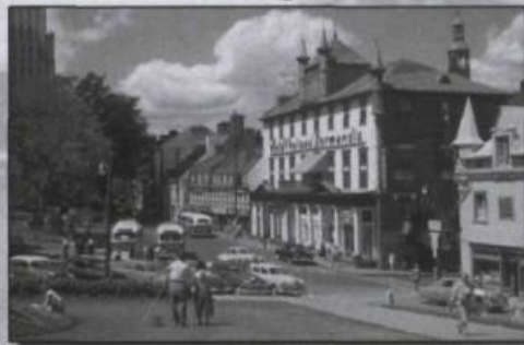
Cartes postales "Collection Art" Plus de 300 modèles disponibles