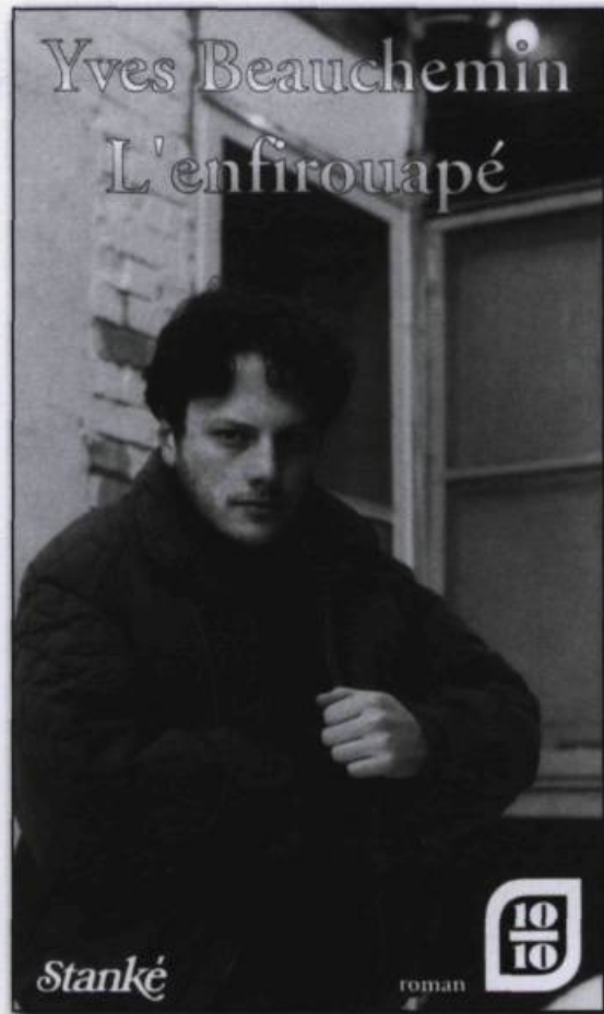
Page couverture de L'enfirouapé d'Yves Beauchemin, 1974, 263 p. (Collection Cap-aux-Diamants).

Une recherche dans la documentation du TLFO permet de trouver des mots dont la forme et le sens pourraient bien avoir été à la source de celui qui nous occupe. Il semble que nous ayons affaire à un croisement entre le verbe argotique enfifrer (qui signifiait « enculer », mais aussi « tromper »), attesté en argot parisien au XIX e siècle (voir Delesalle 1896 et Chautard 1931, p. 374), et le verbe québécois, aujourd'hui désuet, rouâper signifiant « râper » mais aussi « gronder, réprimander », dérivé de rouâpe (sorte de tisonnier), mots bien attestés à l'époque où apparaît enfifrewâper (Fonds TLFO). Ces deux éléments per-