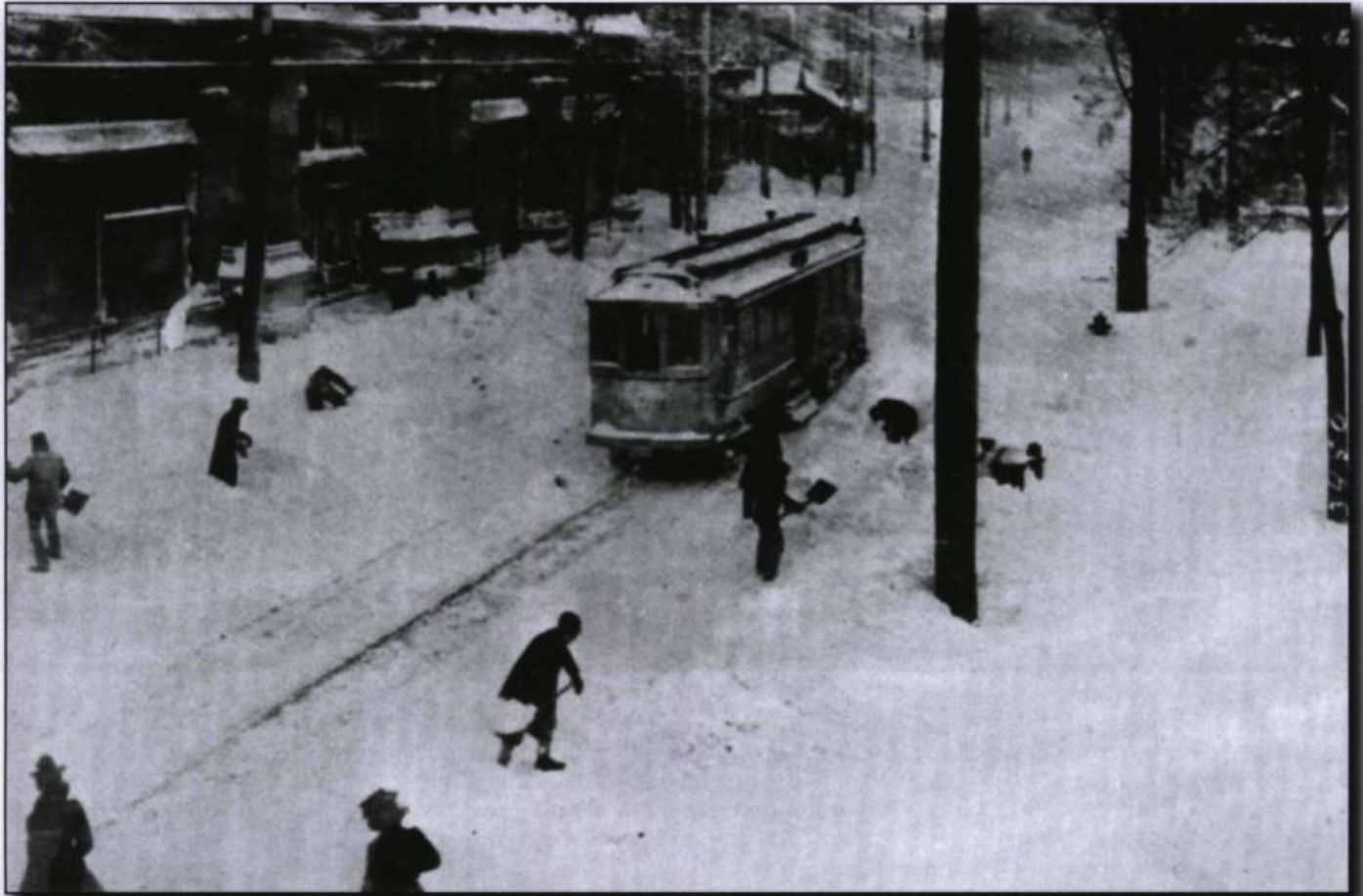
■ Cette photographie de William Notman montre la rue Sainte-Catherine à Montréal, en 1901, après une bordée de neige.

pour des centaines de mots dans le français de référence (le français des dictionnaires), par exemple pour chavirer , envergure , mettre les voiles , ( être , tomber ) en panne , etc. qui s'emploient dans la vie de tous les jours et dont on a presque oublié l'origine maritime. Mais les façons de parler du peuple sont toujours suspectes aux yeux des chevaliers du bon langage. On trouve une dénonciation des mots maritimes à sémantisme élargi dans le premier recueil correctif canadien, celui de l'abbé Thomas Maguire ( Manuel des difficultés les plus communes de la langue française , Québec, 1841, p. 120-121) :