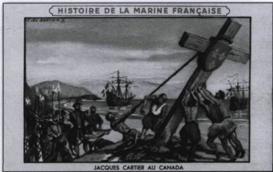
JACQUES CARTIER AU CANADA

Toujours est-il qu'il existe toute une série de mots qui nous sont parvenus à travers la langue des régions de France où les termes maritimes avaient pris des acceptions terrestres. On pourrait citer encore le mot pont , dans poêle à deux ponts , poêle à trois ponts (par analogie avec le pont d'un bateau), désignant un poêle constitué d'un foyer avec un ou deux fours superposés. Sans doute est-ce le cas aussi du mot tuque qui se disait d'une tente ou d'un abri que l'on élevait à l'arrière d'un vaisseau. Notre bonnet d'hiver aurait été ainsi dénommé du fait de sa forme et de sa fonction qui est de mettre la tête à l'abri du froid et de la neige.