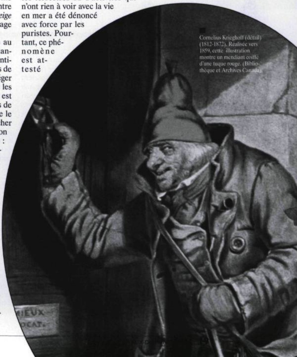
Cornelius Krieghoff (détail) (1812-1872). Réalisée vers 1859, cette illustration montre un mendiant coiffé d'une tuque rouge.

■ Tirée d'une série sur l'histoire de la Marine française, cette carte publicitaire montre Jacques Cartier et ses marins prenant possession du Canada au nom de François 1 er, en 1534.