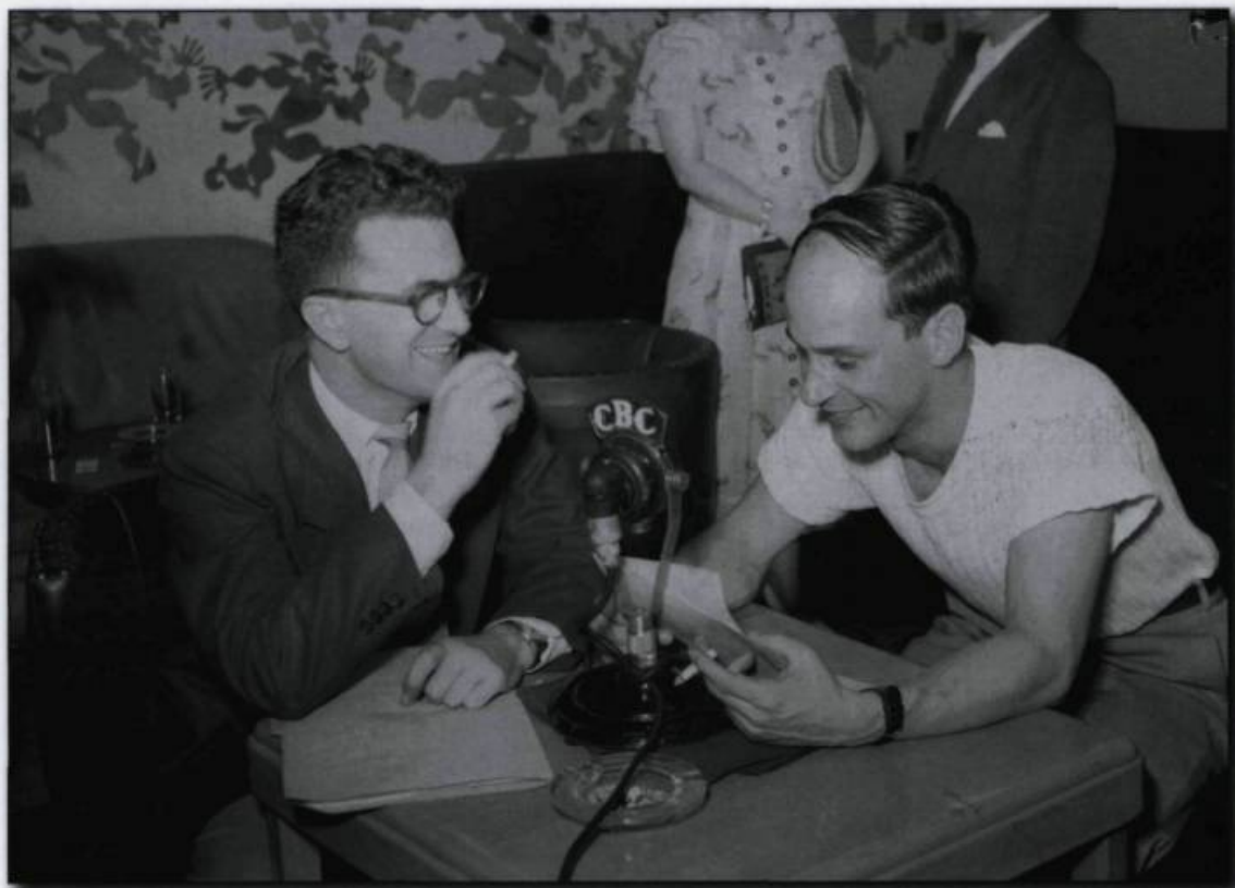
René Lévesque, journaliste à CBC, en compagnie d'un collègue au Cercle des journalistes de Montréal, juin 1949. (Bibliothèque et Archives nationales du Québec, Centre d'archives de Montréal. Fonds Conrad Poirier (P48)).

Malheureusement, la requête de Hocquart pour la construction d'un bâtiment spécifique à la conservation des archives ne sera pas retenue par l'autorité royale. Malgré ce refus, Hocquart persiste et fait aménager un dépôt au palais de l'intendant à Québec. Cette initiative a permis, au grand bonheur des historiens, de préserver une part importante des archives politiques, administratives et gouvernementales produites sous le Régime français.