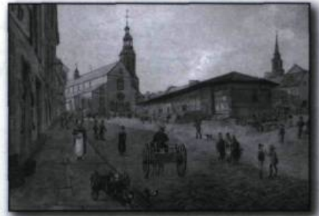
James Pattison Cockburn. La rue de la Fabrique et la cathédrale Notre-Dame de Québec , aquarelle et graphite sur papier, vers 1829.

D'autres créateurs pratiqueront un art dans lequel on peut voir aujourd'hui une chronique de la vie quotidienne et un témoignage sur le développement urbain de la cité. C'est le cas des aquarelles, empreintes de calme et d'harmonie coloniale, du peintre topographe anglais James Pattison Cockburn qui propose diverses vues de la capitale entre 1829 et 1831, des tableaux apocalyptiques que Joseph Légaré consacre aux grandes tragédies – choléra, éboulis, incendies – qui ont bouleversé Québec pendant la première moitié du XIX e siècle, des représentations visuelles réalisées à la fin du XIX e siècle par Jules-Ernest Livernois qui utilise alors une nouvelle technique, la photographie, dont on ne sait pas encore si elle est un art.