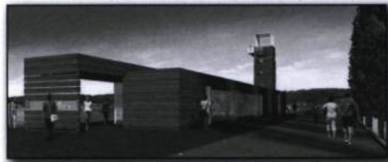
Illustration du pavillon d'accueil du quai des Cageux, à l'extrémité ouest de la promenade Samuel-De Champlain, dont les lignes rappellent des empilages de bois. Conception et design : Le consortium Daoust Lestage inc. Williams, Asselin, Ackaoui, Option Aménagement ©. (Commission de la capitale nationale du Québec).

Le long du Saint-Laurent, les madriers s'étendent à perte de vue de la fin avril jusqu'au gel. En hiver, plusieurs ouvriers travaillent comme bûcheron en Outaouais, coupant le bois avec lequel ils reviendront au printemps : ces ouvriers qui dirigent les radeaux sont appelés cageux ou raftmen . Majoritairement Canadiens français, ils