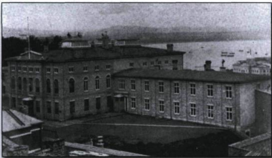
■ Le second parlement en 1865.

l'ensemble du palais, et ce, non sans s'endetter. En 1777, il consent donc à louer l'édifice au gouvernement. Le gouverneur Guy Carleton et ses conseillers législatifs s'y réunissent. C'est alors le début officiel de la vocation politique du lieu, bien que lors de l'incendie du palais de l'intendant, en janvier 1713, le palais épiscopal avait accueilli temporairement l'intendant Michel Bégon et le Conseil souverain.