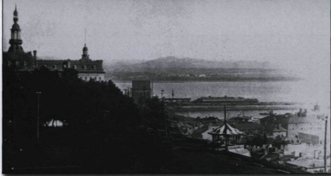
Le parc Frontenac vers 1898.

hôtel du Parlement, sur le terrain appelé Cricket Field, face aux fortifications. Les députés et fonctionnaires y emménagent plus vite que prévu puisque le 19 avril 1883, l'hôtel du Parlement est une fois de plus détruit par un incendie.