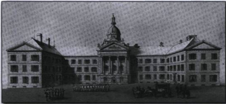
■ Premier parlement vu de l'avant. Litographie de Sarony et Major publiée à New York en 1852.