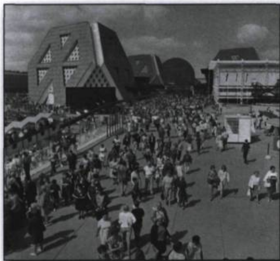
Les pavillons thématiques – des tétraèdres géants et tronqués – ont étonné les visiteurs. (Montréal 67, octobre, p. 7).

Lorsqu'ils entrent sur le site de l'Expo, les visiteurs découvrent un monde extraordinaire : la Terre des Hommes, où diversité rime avec unité. Les 62 pays et les 268 entreprises qui s'exposent se sont affai-