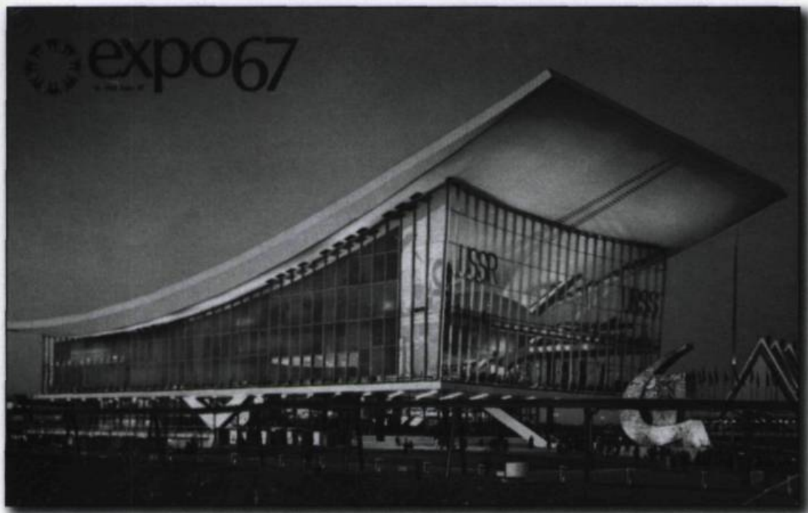
Pavillon de l'URSS à Expo 67. D'une superficie de 175 000 pieds carrés, le pavillon de l'Union soviétique a comme thème « Tout au nom et au profit de l'Homme ». Carte postale, 1967.

établies, les préséances que nous avons créées par décret, alors donc, ces visiteurs officiels à Québec n'étaient plus à proprement parler, au sens strict du mot, n'étaient plus au Canada, mais dans une région autonome qui avait ses règles et qui avait son régime particulier, et qui agissait de sa propre autonomie. À aucun moment, un membre du gouvernement fédéral n'accompagnait un chef d'État ou de gouvernement étranger à Québec. C'est contre la pratique internationale. Donc, voilà, on constatait qu'il existait quelque chose à Québec qui n'existait pas dans le reste du Canada sur le plan politique, sur le plan constitutionnel.»