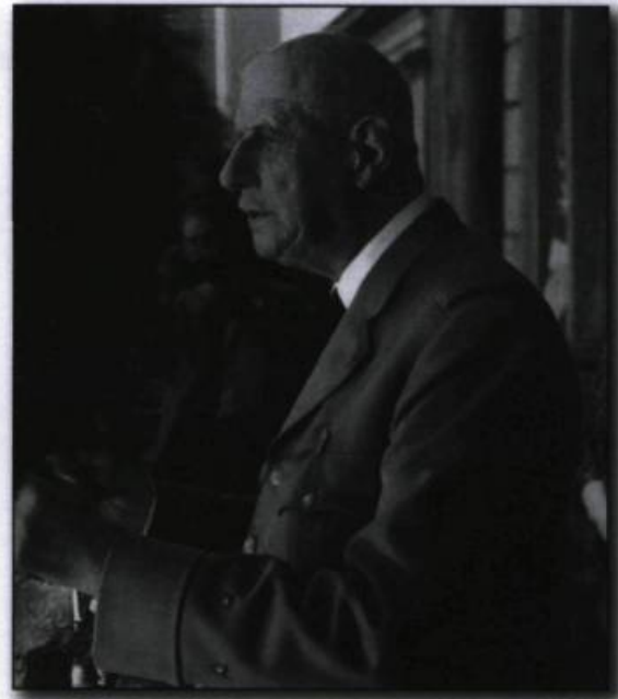
Parmi les nombreux dignitaires étrangers accueillis à Expo 67, Charles de Gaulle, président de la République française fut l'un des plus remarquables. (Montréal 67, septembre, p. 5).

apprécier le « génie » de leur « nous » : d'individus d'une entité politique quelconque, ils deviennent symboliquement les membres d'une entité politique devenue notoire et remarquable.