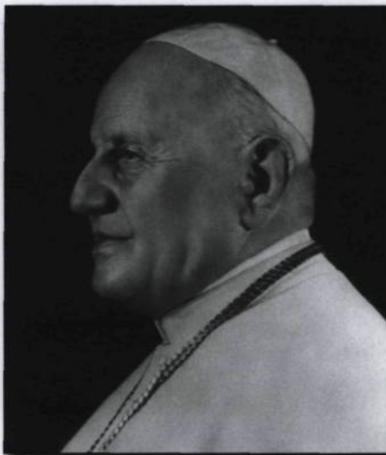
Le pape Jean XXIII (Angelo Giuseppe Rocelli, 1881-1963) convoque le deuxième concile du Vatican, en 1962. Carte postale photographique, vers 1960.