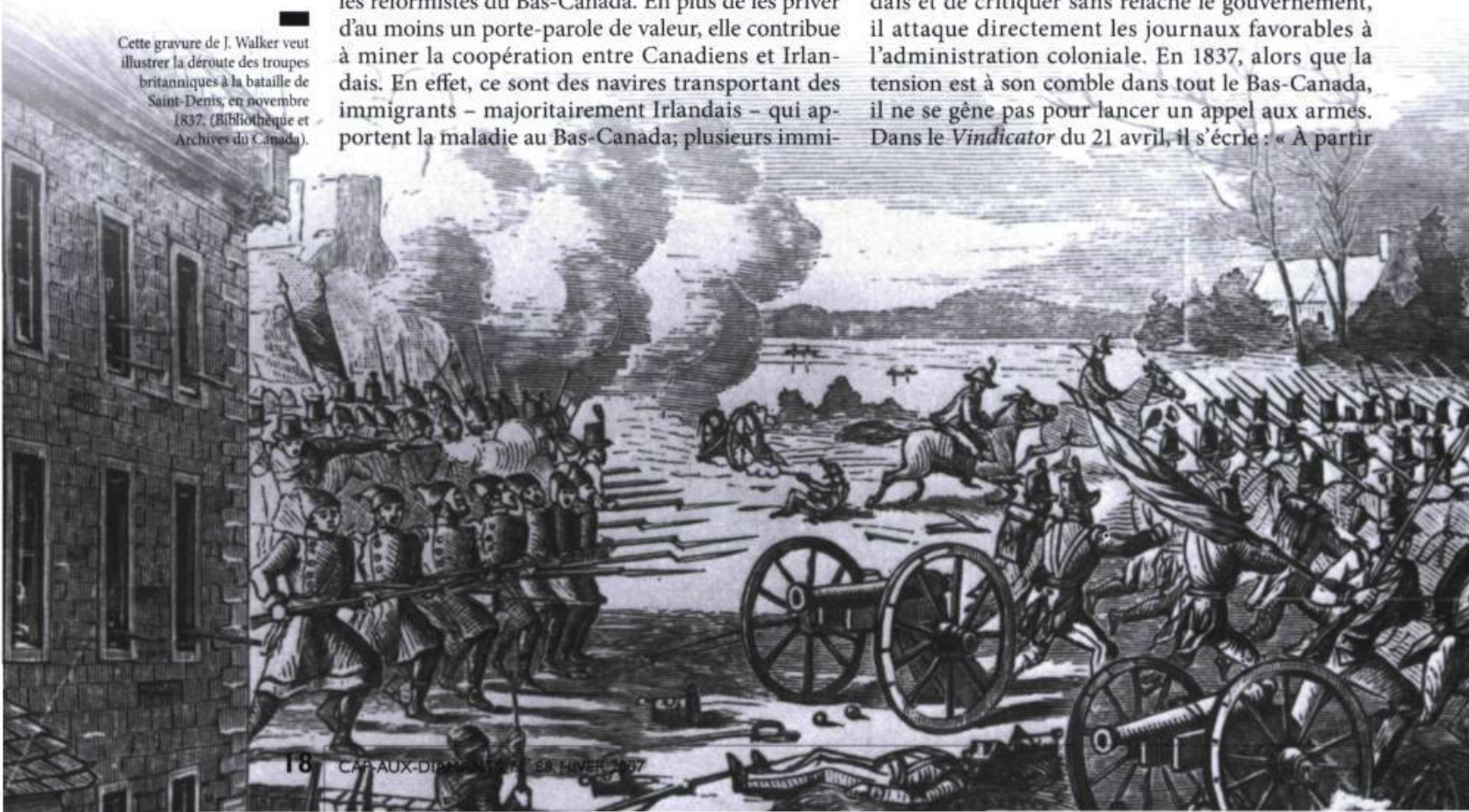
Cette gravure de J. Walker veut illustrer la déroute des troupes britanniques à la bataille de Saint-Denis, en novembre 1837.

En 1833, O'Callaghan déménage à Montréal pour y devenir rédacteur en chef du Vindicator . À l'image du mouvement réformiste qui s'est radicalisé au fil des ans, son style est beaucoup plus virulent que ceux de Waller et Tracey. Non satisfait de célébrer l'alliance entre patriotes canadiens et irlandais et de critiquer sans relâche le gouvernement, il attaque directement les journaux favorables à l'administration coloniale. En 1837, alors que la tension est à son comble dans tout le Bas-Canada, il ne se gêne pas pour lancer un appel aux armes. Dans le Vindicator du 21 avril, il s'écrie : « À partir