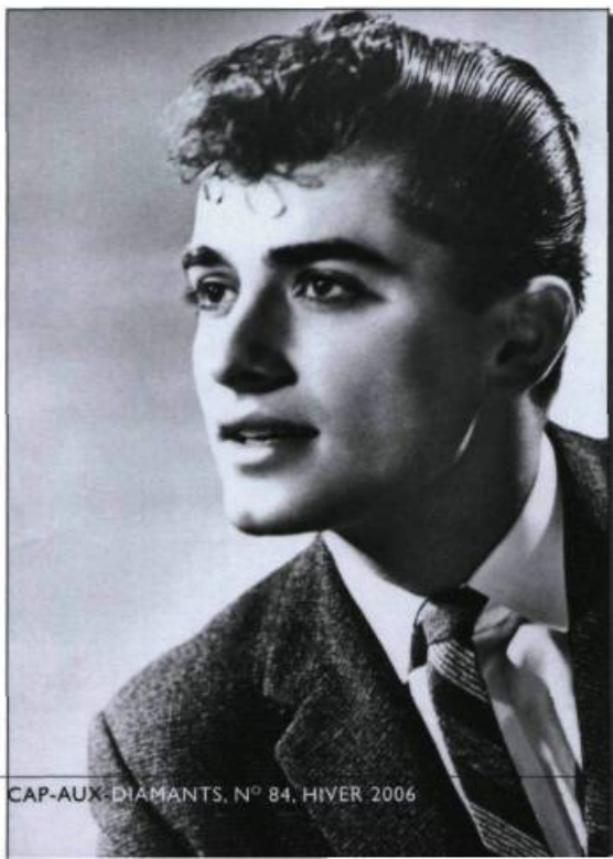
Michel Louvain. Carte postale Photo-Vedettes, vers 1957.