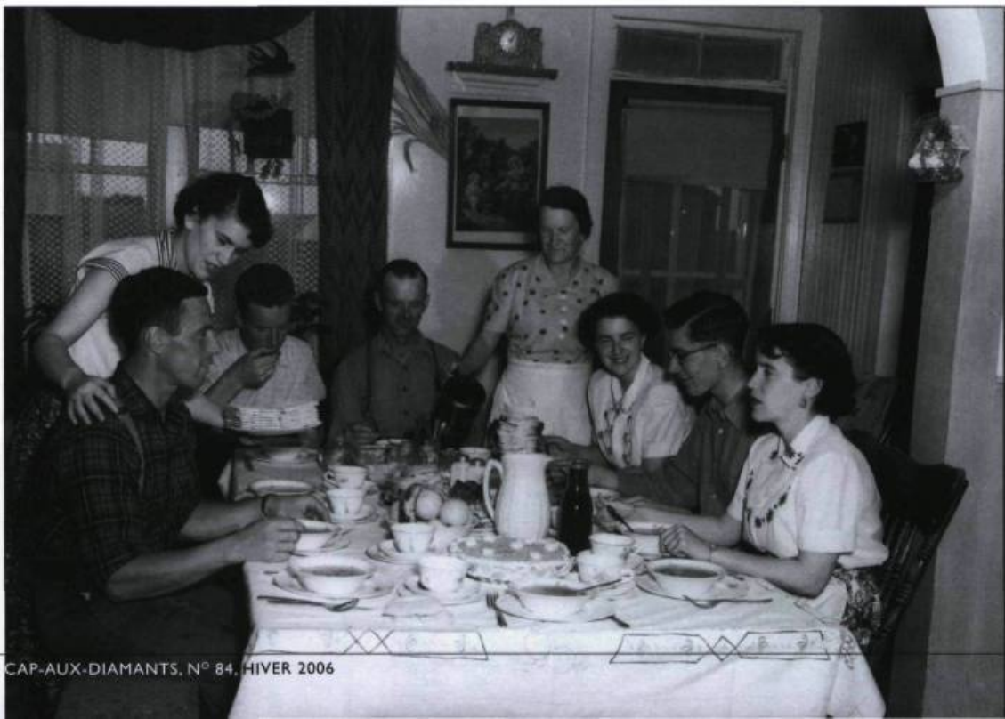
Famille d'agriculteurs. Photo. Office de publicité, 1954. (Collection Yves Beaugard).

Ce qu'on a nommé «l'exode rural» a particulièrement marqué la fin de cette décennie. De 1956 à 1961, le Québec a perdu 23 % de sa population agricole. L'ensemble de la population rurale a baissé de 10 % entre les deux recensements. Les grandes villes exerçaient un fort effet d'attraction sur les jeunes. Ces derniers n'ont pas quitté la province comme à d'autres époques, mais sont allés grossir les grandes villes, Montréal principalement. Les observateurs expliquent cet exode par la baisse du revenu net des agriculteurs, la montée du prix des biens de consommation et l'effet des moyens de communication sur la mobilité géographique par la capacité d'achat d'automobile, l'amélioration du système routier et la stimulation des médias d'information. Les immigrants, de souche italienne pour plusieurs, s'ajoutaient à la population de Montréal pour grossir celle de langue anglaise. Du point de vue démographique, le Québec était, à tous points de vue, en pleine ébullition.