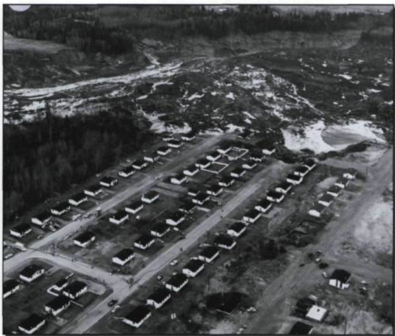
Aspects du glissement de terrain à Saint-Jean-Vianney, le 5 mai 1971.

En attendant, le gouvernement fédéral annonce qu'il offrira une aide monétaire afin d'alléger le sort des sinistrés. De son côté, le gouvernement provincial organise un centre d'accueil, renforce la présence policière sur le lieu du drame, poursuit la recherche de survivants avec le soutien de l'armée canadienne et commande à des ingénieurs les premières