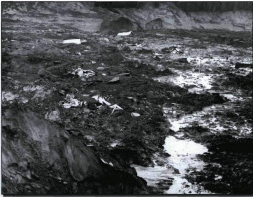
Aspects du glissement de terrain à Saint-Jean-Vianney, le 5 mai 1971. (Album SHS, 14,2. Archives nationales du Québec à Chicoutimi).

études sur les causes de la tragédie. C'est à ce moment que l'ingénieur Pierre Larochelle, coordonnateur des études géotechniques, amorce sa dangereuse exploration du cratère afin d'étudier les causes géologiques de l'affaissement de Saint-Jean-Vianney. Avant d'effectuer toute analyse scientifique, le chercheur propose de stabiliser les lieux fragilisés le plus tôt possible, car ils peuvent présenter une source possible d'érosion accélérée à la suite des événements du 4 mai. Cette stabilisation commencera peu après les recommandations de monsieur Larochelle et sera sous la responsabilité du gouvernement.