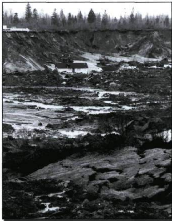
Aspects du glissement de terrain à Saint-Jean-Vianney, le 5 mai 1971.

études sur les causes de la tragédie. C'est à ce moment que l'ingénieur Pierre Larochelle, coordonnateur des études géotechniques, amorce sa dangereuse exploration du cratère afin d'étudier les causes géologiques de l'affaissement de Saint-Jean-Vianney. Avant d'effectuer toute analyse scientifique, le chercheur propose de stabiliser les lieux fragilisés le plus tôt possible, car ils peuvent présenter une source possible d'érosion accélérée à la suite des événements du 4 mai. Cette stabilisation commencera peu après les recommandations de monsieur Larochelle et sera sous la responsabilité du gouvernement.