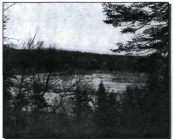
Vue montrant le bas de la rivière Sainte-Anne. Le cours de la rivière s'est sensiblement élargi. La Voix nationale , vol. 27, n° 12 (juin 1954), p. 7.

Dans un article paru en 1954, André de la Chevrotière décrit l'ampleur du glissement de terrain. «À quelques arpents de l'église