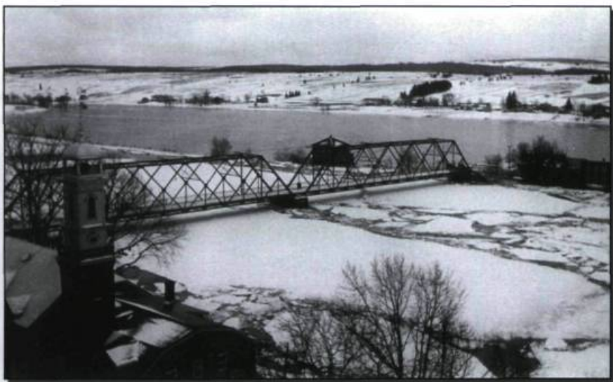
■ Inondation du printemps 1947 à Sainte-Marie. La glace, non encore entièrement fragmentée, occupe le lit de la Chaudière tandis que l'eau a envahi les fonds de la rive gauche. Le chemin de rang et les maisons sont situés un peu au-dessus du lit majeur de la rivière.

La saison n'était pas encore terminée, loin de là! Dans la journée du 30 juillet et pendant la nuit suivante, en moins de 24 heures, on enregistra à Beauceville près de quatorze centimètres de pluie. S'ensuivit le lendemain la pire inondation de toute l'histoire beauceronne dans la partie de la vallée s'étendant depuis Saint-Martin jusqu'à Sainte-Marie. La rivière en furie transporta les ponts arrachés, celui de Vallée-Jonction en particulier, maisons, toitures et, bien entendu, d'importantes quantités de bois de pulpe et de billots. Cette fois, les estacades ne purent retenir tout ce bois dont une bonne partie s'engouffra dans les chutes de Charny avant de se perdre dans le Saint-Laurent. Les trains du Québec Central furent paralysés pendant plus de deux semaines et on dut réparer la voie ferrée tout comme les routes et chemins bordant la Chaudière. Plusieurs agriculteurs perdirent une grande partie de leur récolte de foin, de céréales et de légumes au cours de cette crue désastreuse qui affecta 16 000 per-