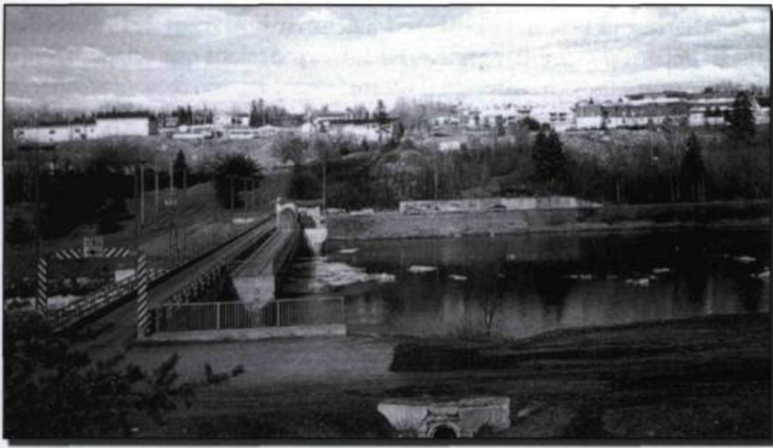
■ Barrage Sartigan érigé à Jersey Mills, en 1967, à la confluence des rivières Chaudière et du Loup. Un ancien cimetière protestant a dû être relocalisé lors de la construction du barrage.

(sic) dans le vestiaire de la sacristie, environ dix-huit pouces de haut, ce qui n'avait jamais eu lieu.» Il termine en disant que la glace est demeurée stationnaire jusqu'au 25 et que les pertes des marchands de Beauceville sont estimées «à peu près à $22, 000.»