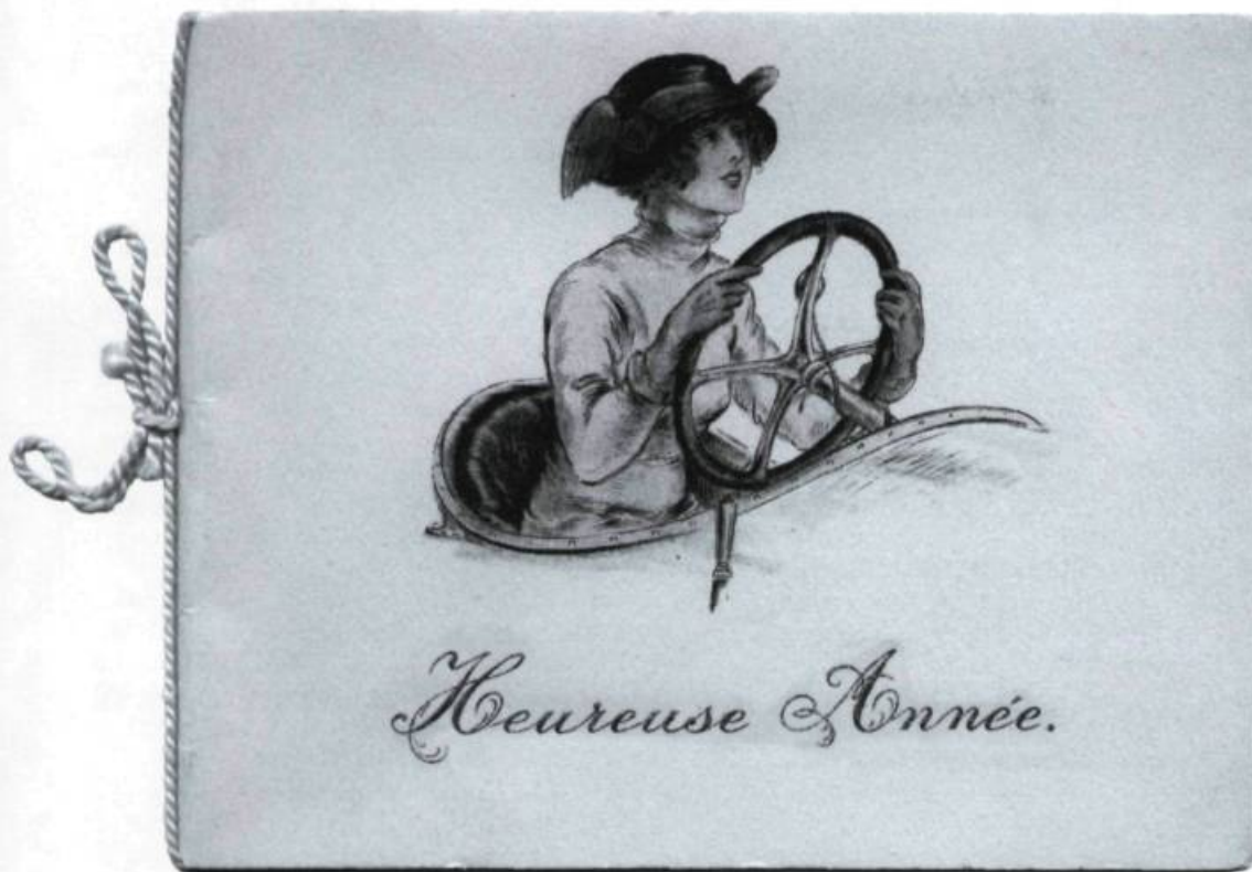
Dans les années 1930, de belles Acadiennes qui travaillent aux États-Unis «ne croient plus au père Noël!» Carte de vœux. (Archives de l'auteur).