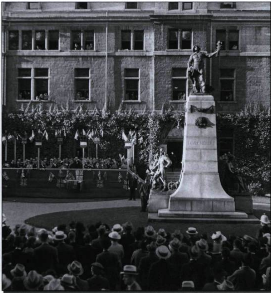
Le monument de Louis Hébert a été déplacé dans le parc Montmorency lors de la construction du stationnement de l'hôtel de ville. On voit ici une foule réunie dans les jardins de l'hôtel de ville pour célébrer le 400 e anniversaire de l'arrivée de Jacques Cartier à Stadaconé.