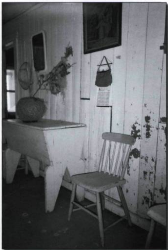
La cuisine du meunier.

Sept ans plus tard, la crue des eaux et la descente des glaces de la rivière arrachent l'écluse et les dalles. L'actuel propriétaire, Jean-Louis Paradis, laisse échapper ces mots : «Nous avons mis de l'argent à l'eau».