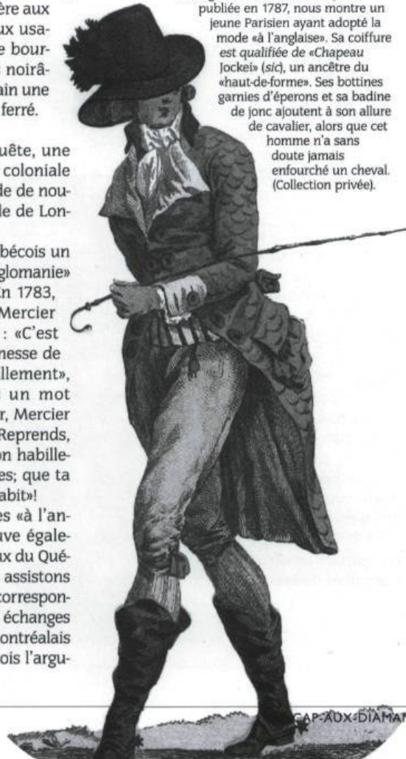
Cette gravure de mode française, publiée en 1787, nous montre un jeune Parisien ayant adopté la mode «à l'anglaise». Sa coiffure est qualifiée de «Chapeau Jockey» ( sic), un ancêtre du «haut-de-forme». Ses bottines garnies d'éperons et sa badine de jonc ajoutent à son allure de cavalier, alors que cet homme n'a sans doute jamais enfourché un cheval.