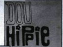
L'Éprouvette, mardi le 30 septembre 1969

L'Éprouvette, vol. 3, n° 3; 30 septembre 1969 Le Carabin ayant cessé d'exister, c'est L'Éprouvette , le journal des étudiants de la Faculté des sciences, qui rapporte la dissolution de l'AGEL.