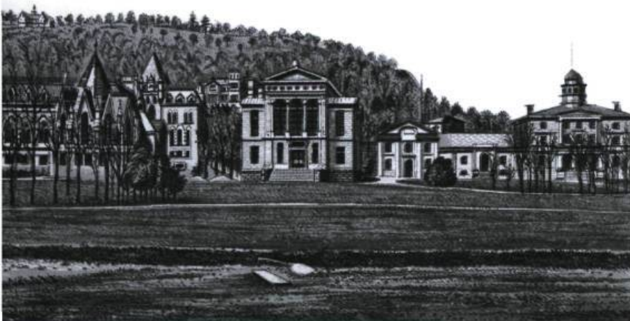
■ L'Université McGill de Montréal a obtenu sa chartre en 1829. (Archives de Cap-aux-Diamants ).

Heureusement, la Commission des écoles catholiques de Montréal, appuyée par le Département de l'instruction publique, créait, en 1873, une école de sciences appliquées : l'établissement porta bientôt le nom de Polytechnique. Du côté de la préparation au monde des affaires, c'est la Chambre de commerce de Montréal qui fut à l'origine, en 1907, de la création de l'École des Hautes Études Commerciales. Ces deux institutions seront éventuellement affiliées à l'Université de Montréal. Du côté de Québec, il faut attendre le premier conflit mondial pour voir la création des écoles de commerce, de chimie, de génie et de foresterie. C'était dans tous les cas une entrée plutôt tardive des institutions francophones, sous la forme d'écoles affiliées plutôt que de facultés de plein droit, dans la forma-