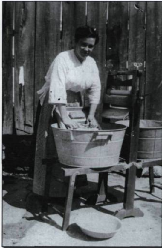
Scène de lavage à l'extérieur. Photographie vers 1915. (Collection Jacques Saint-Pierre).

La lessive chez soi, c'est maintenant une corvée de routine, on la fait n'importe quel jour de la semaine et à n'importe quel moment de la journée. Au début des années 1980, la famille typique de quatre personnes lave au moins une tonne de vêtements par année. Ceci revient à dire que, dans bien des foyers, on lave huit brassées d'un poids moyen de trois kilos, par semaine (Procter and Gamble). Un certain nombre de facteurs ont contribué à faciliter la corvée de la lessive :