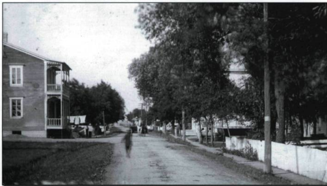
Vêtements sur la corde à Saint-François-de-Montmagny. Carte postale. (Collection Jacques Saint-Pierre).

À la main ou à la machine, aujourd'hui comme hier, les opérations de base restent toujours les mêmes : après le détachage, le triage. D'un côté, on mettait ensemble les vêtements qui peuvent bouillir, de l'autre,