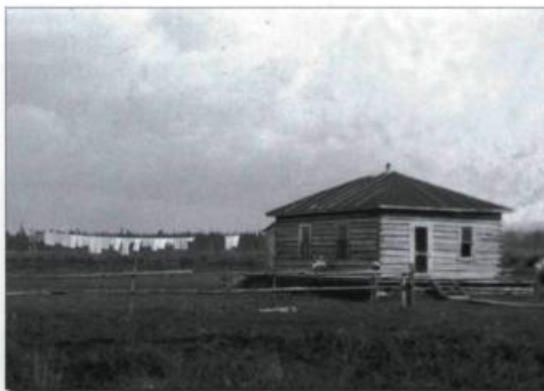
Vêtements séchant sur une corde derrière une habitation rustique de la Beauce. Photographie vers 1920.

Étape hebdomadaire obligée, c'est la journée du lundi qui est consacrée à ce labeur nécessaire, la lessive. On trouvait, dans la plupart des foyers, une machine à essoreuse à rouleaux avec des cuves de rinçage séparées : il fallait l'installer le plus souvent dans la cuisine. À la première heure, on avait tôt fait de sortir le «boiler» pour faire chauffer cette eau encaustiquée pour le lavage des vêtements. «Quand je revenais de l'école le lundi midi (à l'heure des Joyeux Troubadours ), la maison était toujours en démençe», se rappelleront les gens de 60 ans et plus. Avant que la panoplie des détergents pour la lessive soit à la portée de toutes les bourses des milieux urbains et ruraux, le savon faisait figure de maître dans l'entretien général des vêtements. Ceux dont on entendait parler portait le nom de Barsalou et Comfort. Il y avait aussi le savon de Marseille, moins accessible et plutôt pour les soins du corps. Sans oublier le savon d'habitant, fabriqué au cours du prin-