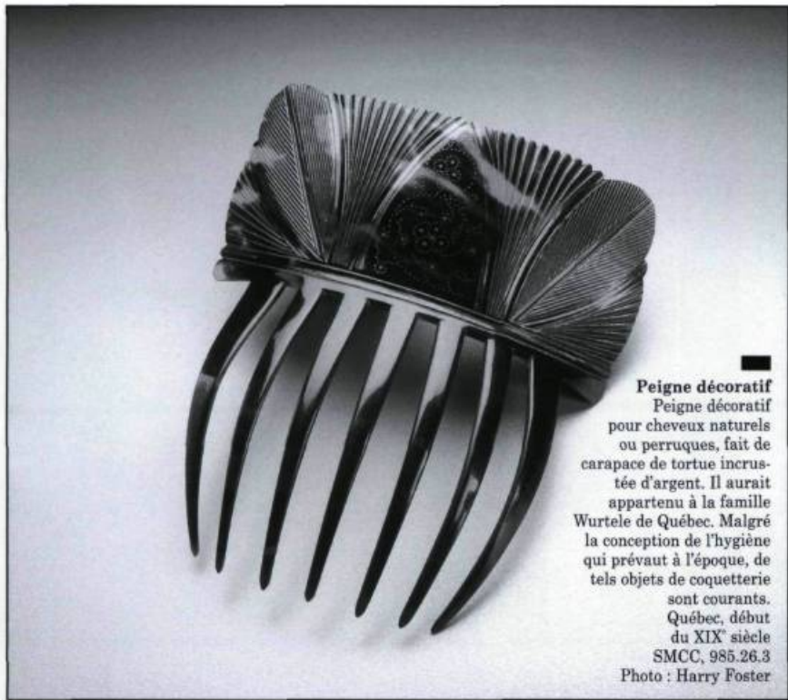
Peigne décoratif Peigne décoratif pour cheveux naturels ou perruques, fait de carapace de tortue incrustée d'argent. Il aurait appartenu à la famille Wurtele de Québec. Malgré la conception de l'hygiène qui prévaut à l'époque, de tels objets de coquetterie sont courants. Québec, début du XIX e siècle SMCC, 985.26.3