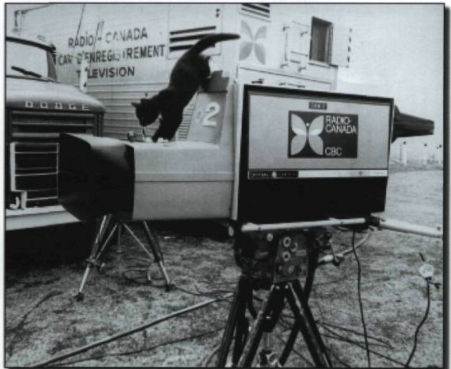
Début des émissions en couleurs au Canada, en 1966.

1969 : Création de Radio-Québec (maintenant Télé-Québec).