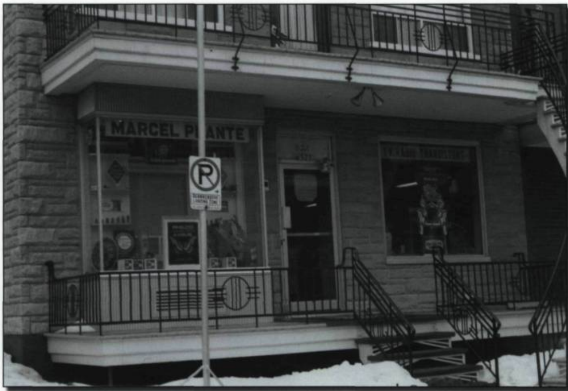
Atelier de Marcel Plante (extérieur), vers 1970. (Archives de la famille Plante).

La détérioration des téléviseurs survenait normalement après deux ou trois ans. Un problème d'image déformée ou moins nette, une intermittence du son ou pire : le noir complet. Évidemment, la plupart des familles ne possédaient qu'un seul téléviseur et la panne signifiait la privation totale. L'achat d'un téléviseur pouvait représenter une somme importante, souvent plus de 400 $, soit le salaire de plusieurs mois. Il fallait donc envisager la réparation lorsque celle-ci devenait inévitable. Les embûches étaient nombreuses : les téléviseurs étaient souvent lourds, encastrés dans de gros meubles que l'on ne pouvait transporter que difficilement, dans un camion ou une remorque. L'atelier de Marcel Plante était la plupart du temps encombré de nombreux appareils en panne. Sur chacun se trouvait un bout de papier portant le nom du propriétaire et le type de problème : «pas de son» ou «l'image saute» ou encore «l'image s'en va au bout de dix minutes». Faute d'espace, plusieurs téléviseurs