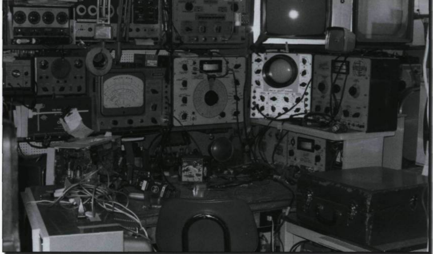
■ Atelier de Marcel Plante (intérieur), vers 1970.

devaient rester sur le balcon d'en avant : ils étaient tout simplement trop larges pour franchir le seuil de l'entrée et trop massifs pour circuler dans le couloir. La réparation devait avoir lieu sur le balcon et ce, même en hiver!