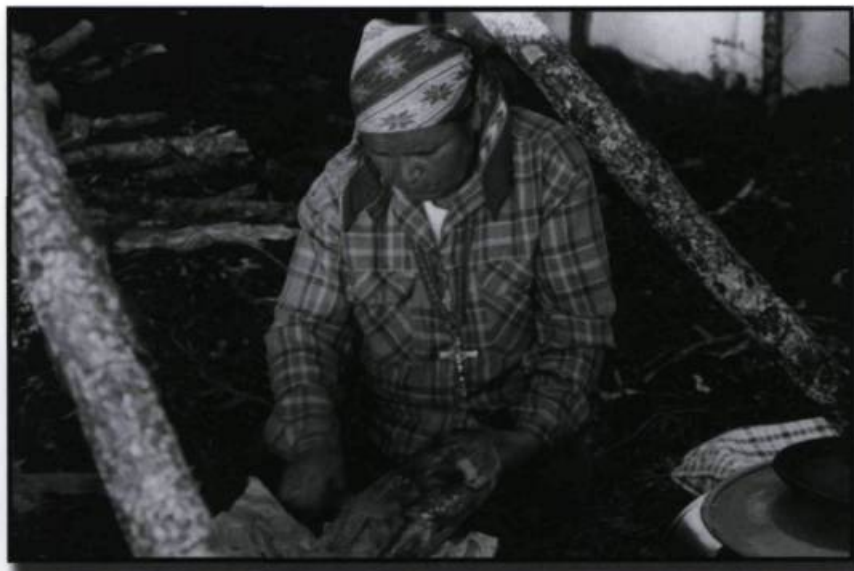
■ Artisane innue procédant à la cuisson du pain amérindien.