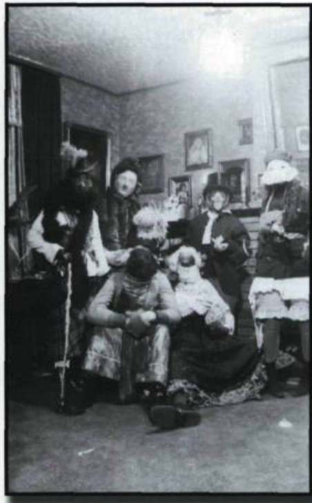
Mardi gras, 1935.

aux couples de la première moitié du XX e siècle, il est facile de déceler un déplacement du centre décisionnel. On va toujours à la noce, mais il y a lieu de se demander ce qui reste des traditions des dernières décennies. Le couple qui se marie tient toujours à montrer publiquement son union par des gestes qui marquent le passage de l'état de célibataire à celui de marié. C'est si vrai que même après plusieurs années de vie commune, on tient à souligner le changement lorsque le statut de conjoint de fait se transforme en mariage.