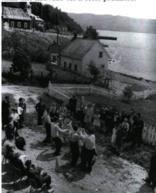
Une contredanse villageoise. Il s'agit sans doute d'une contredanse, vu la disposition des femmes et des hommes. À la Descente-des-Femmes, Sainte-Rose-du-Nord (Saguenay), en 1945.

Le répertoire traditionnel québécois est particulièrement propice à la socialisation. Bien réussir un set ou un quadrille nécessite la mise en commun d'expériences diverses, l'acceptation des différents degrés d'habileté, l'abandon de la compétition et de la performance. On entre dans un jeu de représentation sociale, avec des règles établies, acceptées de tous. Ce «jeu» est basé sur la répétition, créant ainsi la sécurité et l'oubli de soi. On y propose des évolutions nécessitant l'ac-