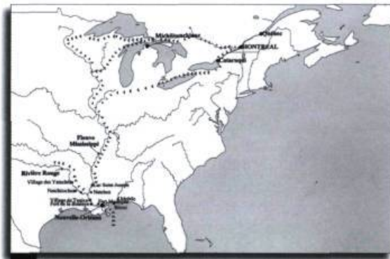
Conception Michèle Garceau

La Louisiane est également célèbre à cause de sa métropole, La Nouvelle-Orléans. Le quartier français de cette ville est bien connu. Fondée en 1718, par Jean-Baptiste Le Moyne de Bienville, La Nouvelle-Orléans a connu, à la fin du XVIII e siècle, plusieurs ouragans (en particulier celui de 1779) et incendies majeurs (1788 et 1794). Ces catastrophes ont pratiquement détruit tous les monuments d'architecture coloniale française. Par conséquent, même si la plupart des habitants de la ville étaient encore de descendance française plusieurs années