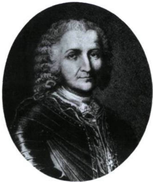
Jean-Baptiste Le Moyne de Bienville. (Archives nationales du Canada, C 100598).

À l'extérieur de La Nouvelle-Orléans, on retrouve peu de structures construites à l'époque de l'occupation française, c'est-à-dire entre 1699 et 1763. La maison Nicholas-LaCour est peut-être la plus ancienne structure de la vallée du Mississippi. Construite dans la paroisse de Pointe Coupée vers 1735, la maison a été transportée sur l'île Jefferson, dans la paroisse d'Iberia, dans les années 1980. Même si peu de structures directement associées à l'occupation française existent toujours en Louisiane, l'importante culture française de l'époque a subsisté pendant plusieurs décennies. On retrouve toujours des exemples du style architectural français dans tout le sud de la Louisiane. Ce sont des structures érigées pendant la période coloniale espagnole (1763 à 1803) et pendant la période américaine. On peut visiter plusieurs maisons et plantations de style français; nombre d'entre elles sont aujourd'hui des gîtes touristiques.