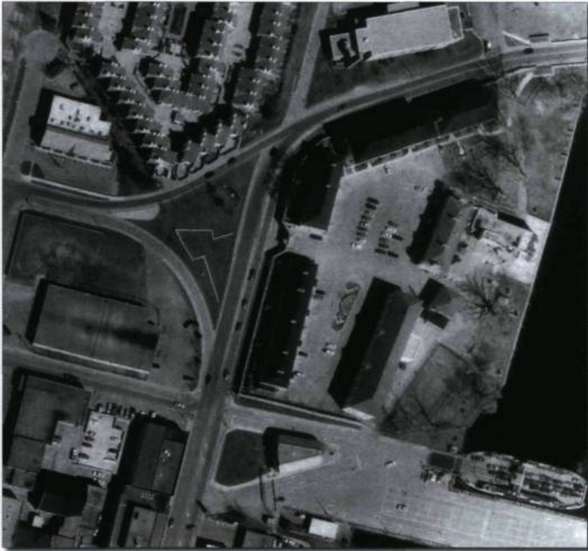
Le site d'aujourd'hui, en pleine ville de Kingston. (Queen's University).

lances en fer et des haches, ont survécu à cet endroit pendant plus de 200 ans. Face au carrefour mouvementé d'aujourd'hui, on imagine difficilement l'arrivée de ces objets par bateau, leur déchargement et leur emmagasinage en vue de la traite des fourrures, les ballots de fourrure transportés vers le fort et les clients satisfaits quittant le fort avec leur paiement.