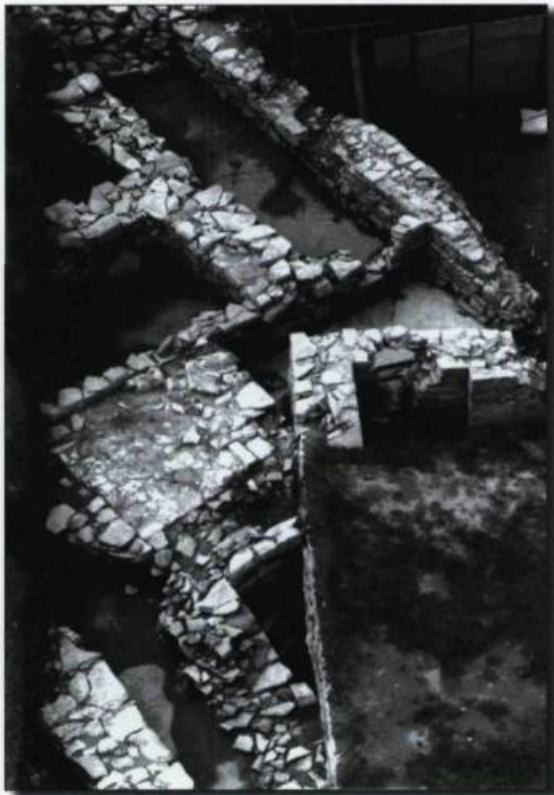
Complexités archéologiques. Le magasin situé le long de la paroi ouest, les quartiers construits ultérieurement et une bâtisse plus récente du XIX e siècle, excavés en 1985. (Cataraqui Archaeological Research Foundation).

vient à mettre au jour des parties du coin nord-ouest du fort Frontenac, situé sur une propriété appartenant à la ville de Kingston. Au cours des années suivantes, nous avons pu approfondir nos connaissances grâce à des fouilles sur les terres de la Défense nationale à l'intérieur du fort Frontenac actuel, ainsi que sur des terres privées.