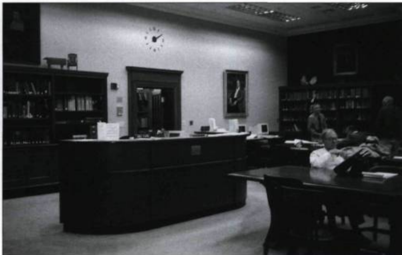
Salle de consultation de la New England Historical and Genealogical Society de Boston. Photographie Sylvie Tremblay, 1998. (Archives de l'auteur).

En septembre 1973, une première rencontre a lieu au collège Saint-Anselme de Manchester, New Hampshire, où près de 40 personnes sont présentes. Vingt-cinq ans plus tard, cette société compte plus de 2 900 membres actifs. Au cours des dernières années, elle a procédé à l'acquisition du presbytère de la paroisse Blessed Sacrament Church de Manchester où a été relouée la bibliothèque. On y retrouve les grands titres de la généalogie québécoise, mais aussi de nombreux ouvrages portant sur les États de la Nouvelle-Angleterre, en particulier le New Hampshire et le Maine. Pour un coût minime, les utilisateurs peuvent avoir accès à la banque Parchemin pour les actes notariés rédigés en Nouvelle-France entre 1635 et 1765. Cette société est très active dans la publication de répertoires de baptêmes, de mariages et de décès. Dernièrement, son champ d'action s'est étendu à l'État de New York, particulièrement la région d'Albany. Adresse : P.O. Box 6478, Manchester, NH 03108-6478 http://www.acgs.org