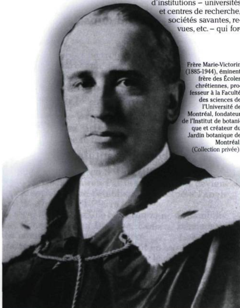
Frère Marie-Victorin (1885-1944), éminent frère des Écoles chrétiennes, professeur à la Faculté des sciences de l'Université de Montréal, fondateur de l'Institut de botanique et créateur du Jardin botanique de Montréal.

L e siècle avait déjà vingt ans lorsqu'on décida qu'il était grand temps que le Canada français rattrape les nations en tête du progrès scientifique et apporte sa modeste contribution au développement des connaissances. C'est dans ce but que la toute nouvelle Université de Montréal, créée en 1920, fut dotée d'une Faculté des sciences. À Québec, l'Université Laval organisait, au même moment, son École supérieure de chimie, ébauche d'une faculté des sciences. En 1923, pour regrouper la première génération des savants «professionnels» et canaliser les énergies, on fondait, à Montréal, l'Association canadienne-française pour l'avancement des sciences. Le mouvement était lancé : de ce cadre initial allait jaillir toute une moisson d'institutions – universités et centres de recherche, sociétés savantes, revues, etc. – qui for-