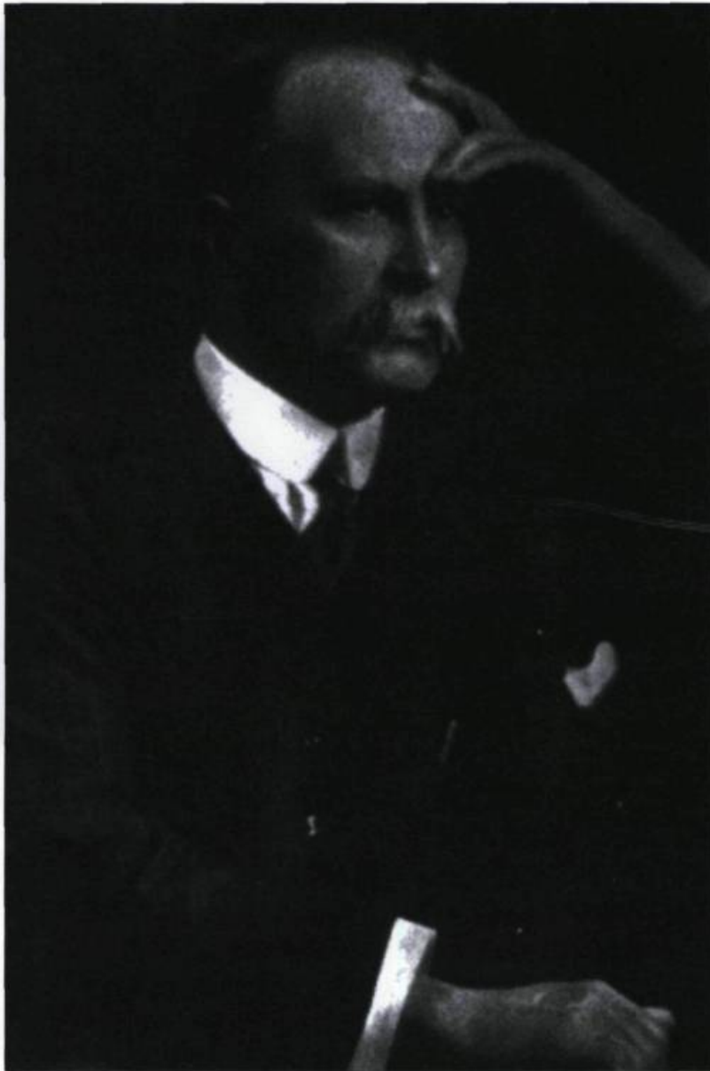
Sir William Osler (1849-1919), éminent médecin et pédagogue.

L'évolution de la botanique illustre assez bien ce qui se produit dans d'autres disciplines. En géologie et en paléontologie, où les chercheurs de l'Université Laval dominant, on évolue également d'une approche taxonomique à une approche plus explicative du paysage géologique et des rapports des espèces entre elles. L'ichtyologie et la biologie marine, qui doivent beaucoup aux laboratoires d'État, créés à partir des années 1930 afin d'appuyer l'industrie de la pêche canadienne, s'intéressent très tôt à l'écologie des espèces qui ont une valeur économique et à la génétique des populations. Au cours des