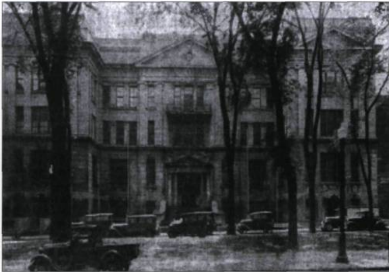
École polytechnique de Montréal, en 1920.

comparable à celle de sa rivale traditionnelle, l'Ontario. Mais l'essentiel des recherches étant toujours le fait des universités et des hôpitaux, les coupures budgétaires importantes vécues par ces institutions au cours des dix dernières années font croire à plusieurs que ce capital si durement acquis est en péril. Ainsi, le fleuron de la recherche canadienne en fusion, le Tokamak de Varennes, a été démantelé faute d'appuis financiers des gouvernements. Les journaux parlent de baisse de qualité de l'enseignement, de la