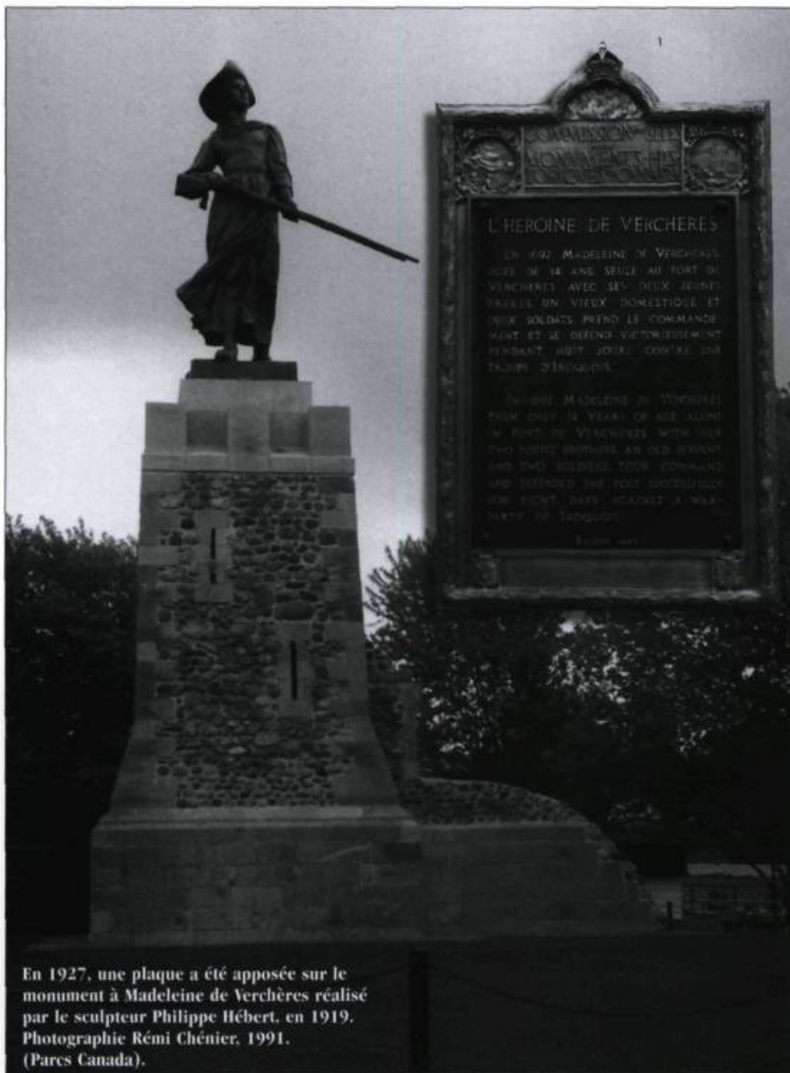
En 1927, une plaque a été apposée sur le monument à Madeleine de Verchères réalisé par le sculpteur Philippe Hébert, en 1919. Photographie Rémi Chénier, 1991. (Pares Canada).

Comment expliquer le tout? Les années fortes correspondent à celles où le brigadier-