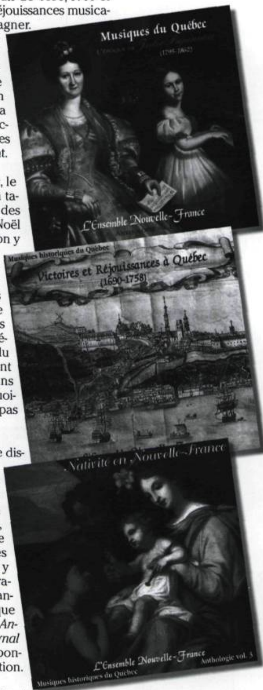
Pochettes des volumes 1, 2 et 3 de l'anthologie de la musique historique du Québec.

Le volume 4 de l'anthologie, L'Épopée mystique , est consacré aux manuscrits anonymes des premières ursulines et augustines de Québec et au