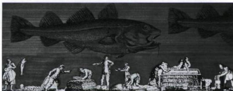
Le métier de pêcheur : la préparation de la morue avant le séchage. (Illustration Associés Libres d'après une gravure du XVIII e siècle).

ger ses colonies d'Amérique. En 1758, les troupes britanniques s'emparent de la forteresse de Louisbourg dans l'île Royale (Cap-Breton) et détruisent tous les postes de pêche dans le golfe de Saint-Laurent. À Pabos, ils brûlent 11 500 quintaux de morue et 120 chaloupes. Après deux années de guerre, la Nouvelle-France capitule.