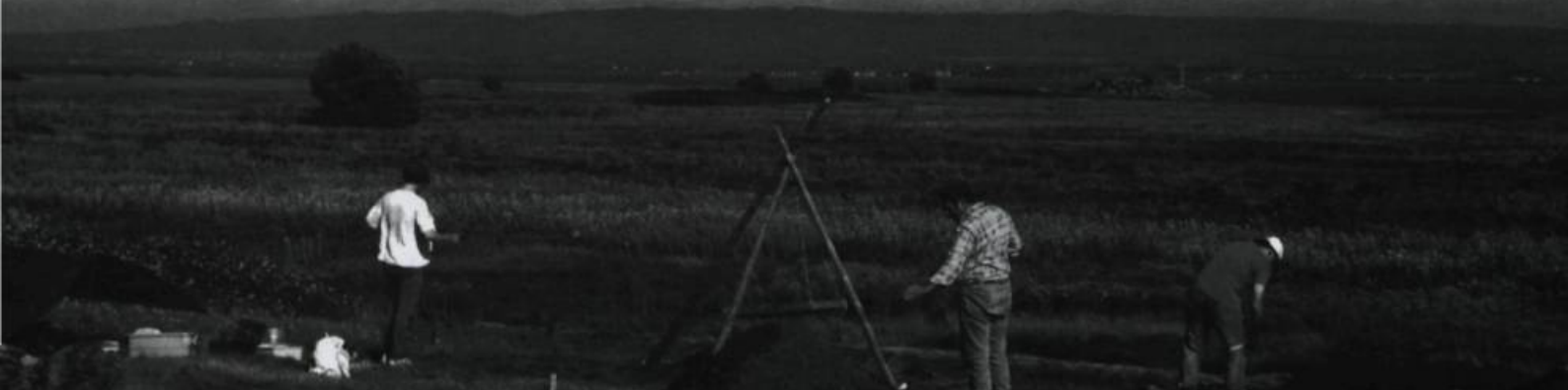
Les fouilles au Rocher de la Chapelle. En arrière-plan, le Saint-Laurent et la Côte-du-Sud.