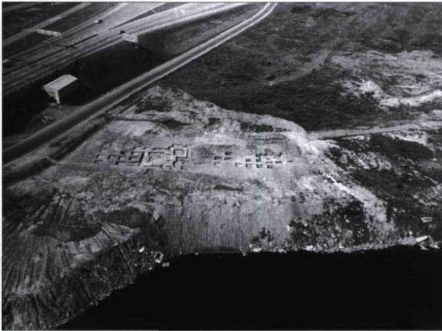
Fondations du manoir LeBer mises au jour en 1969. À gauche, le pont Champlain.

L'intérêt de Jacques LeBer pour cette île suscite une question. Ce commerçant de haut niveau est-il bel et bien devenu agriculteur avec l'acquisition de sa seigneurie insulaire, reconnue comme le fief Saint-Paul, ou cherchait-il, comme tant d'autres, un écran pour ses activités de traite? Les recherches archéologiques et historiques ont jeté un nouvel éclairage sur le sujet.