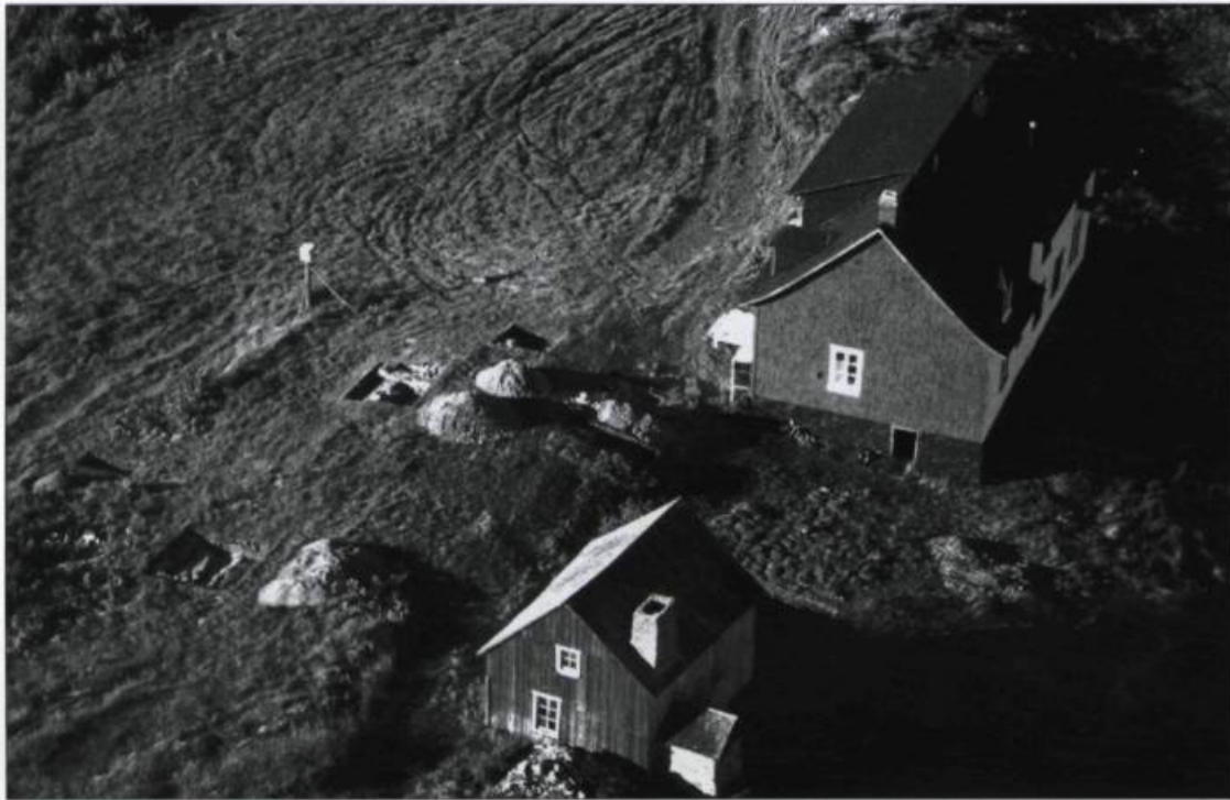
L'île aux Oies dans l'archipel de l'Isle-aux-Grues.