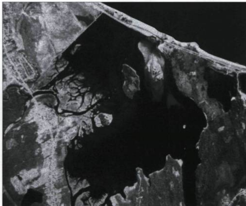
Vue aérienne de la baie de Pabos. L'île Beau Séjour se trouve au centre de la lagune. (Ressources naturelles Canada).

Dans l'archipel de l'Isle-aux-Grues, en face de Montmagny, la beauté du paysage est à couper le souffle. Le Saint-Laurent, encore large à cet