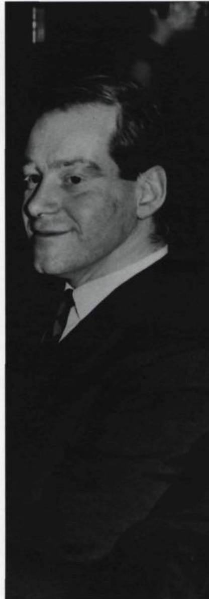
Pierre Bourgault, président du RIN en 1966.

peu sur le plan personnel! Les maîtres à penser ont été étrangers finalement, parce que, à partir de ce moment-là, c'était de la décolonisation. C'était surtout l'Algérie, c'était Albert Memmi et Frantz Fanon. C'est là que j'ai pris mes grands principes. Je n'ai jamais lu Groulx de ma vie, je trouvais ça ennuyeux, au